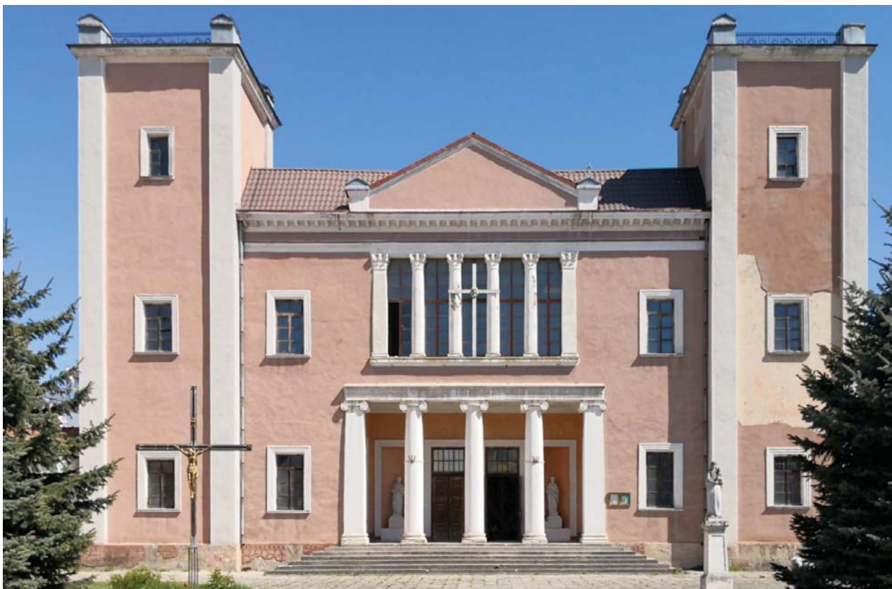
Il. 12. Kościół pw. śś. Piotra i Pawła w Trembowli projektu architekta Adolfa Szyszko-Bohusza.