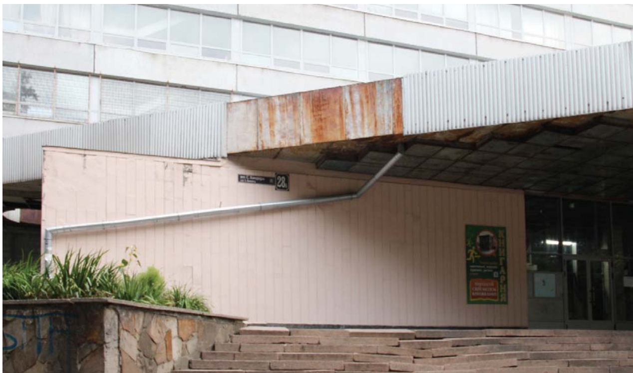
II. 1. Strefa wejściowa do budynku nr 5 Politechniki Lwowskiej przy ulicy Stepana Bandery 28a — dawna ulica Leona Sapiehy.