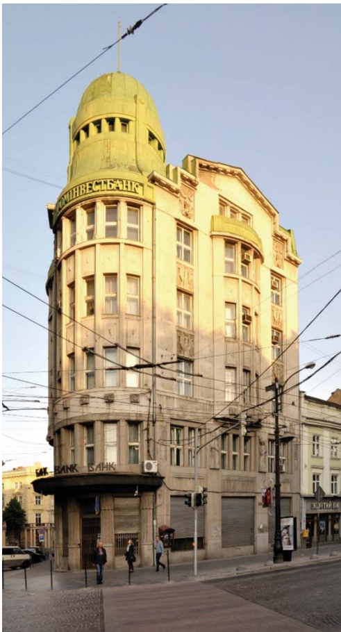
Il. 9. Gmach Banku Praskiego we Lwowie, zrealizowany w latach 1911–1912.

III. 9. The building of the Prague Bank in Lviv, realized in the years 1911–1912.