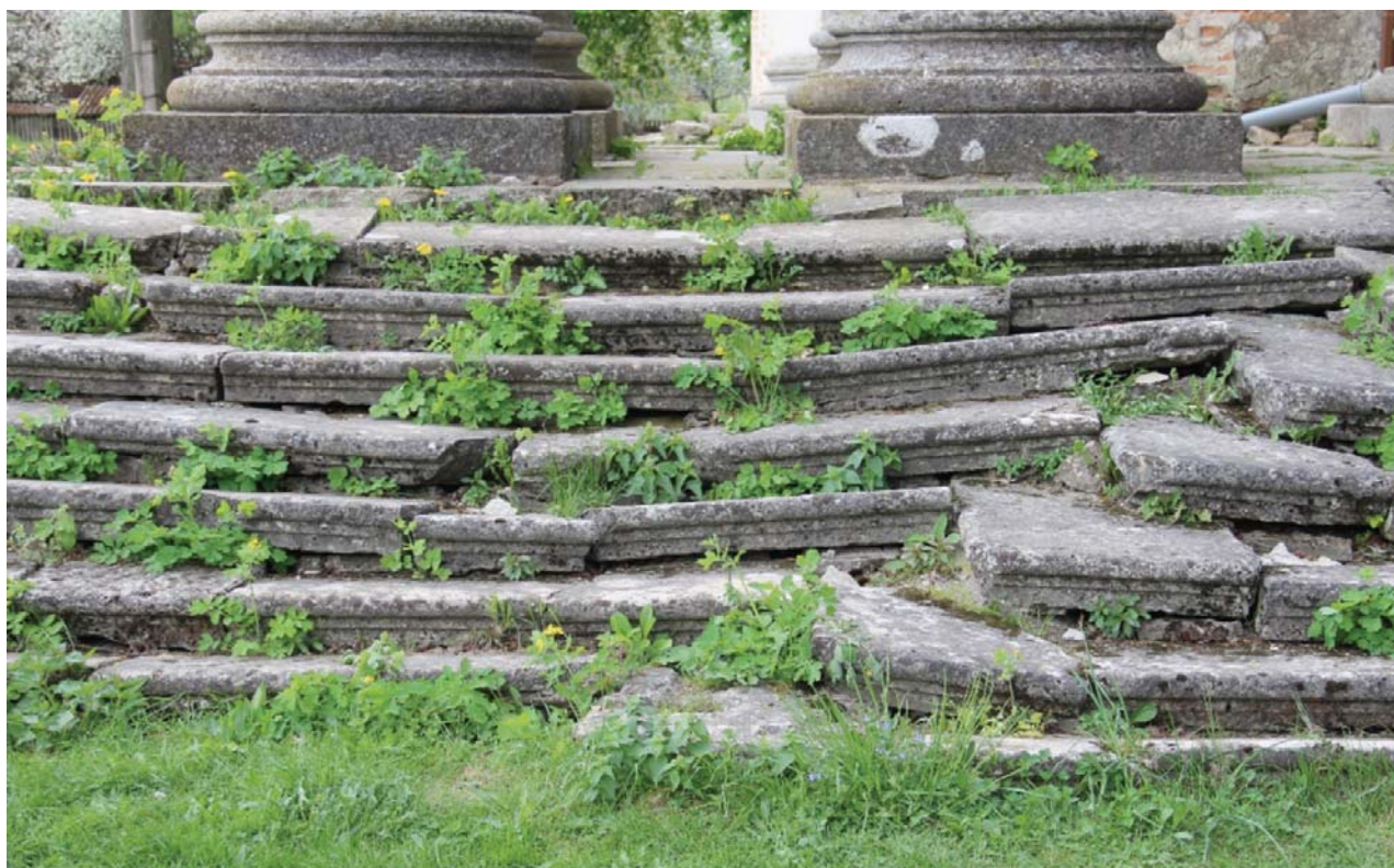
II. 2. Schody zewnętrzne barokowego kościoła pod wezwaniem św. Józefa i Podwyższenia Krzyża Świętego w Podhorcach (świątynia zamkowa), zrealizowanego w latach 1752–1763. Stan z maja 2018.