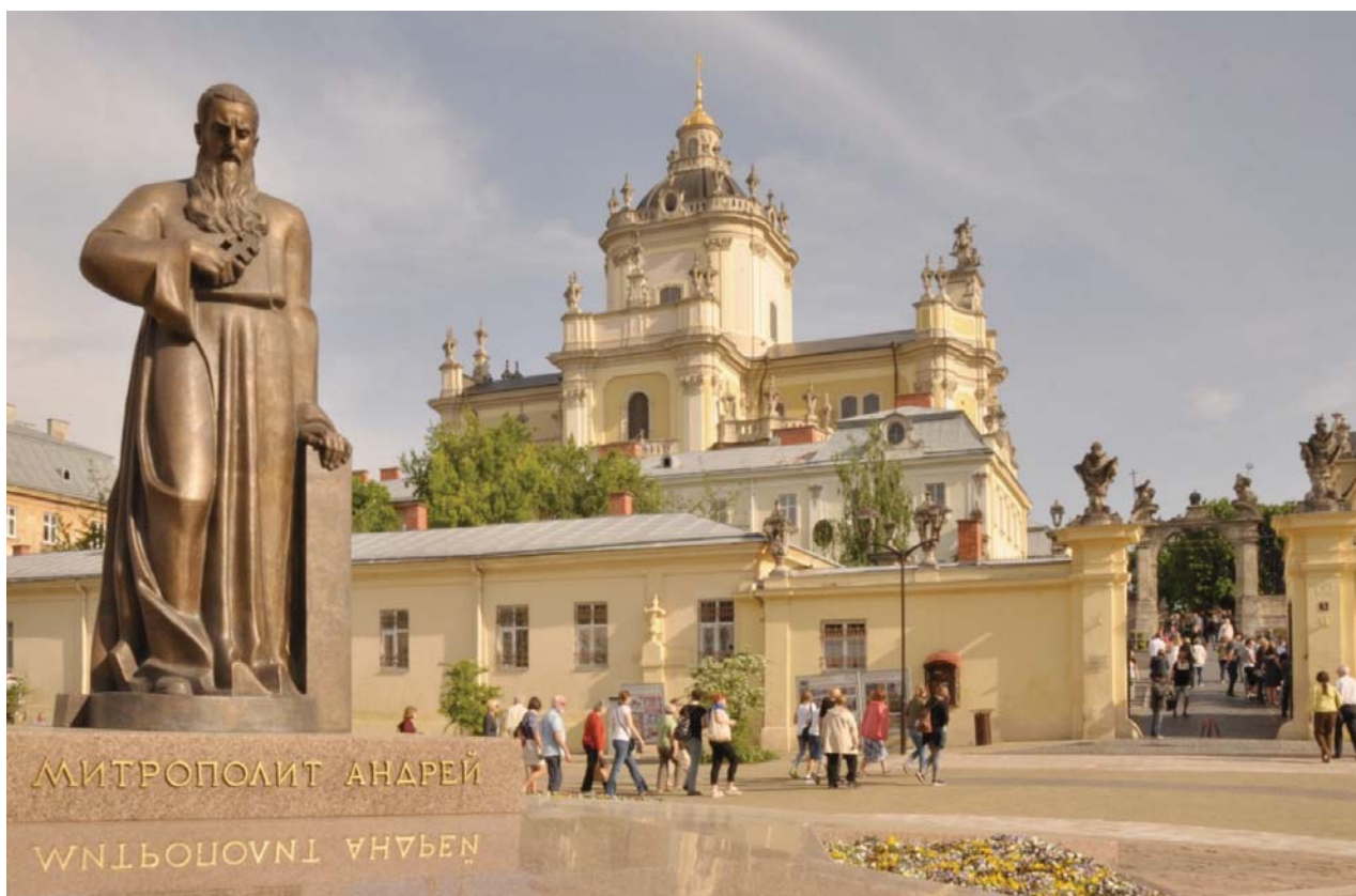
II. 7. Katedra Piotra i Pawła w Kamieńcu Podolskim (fot. Katarzyna Zawada-Pęgiel).