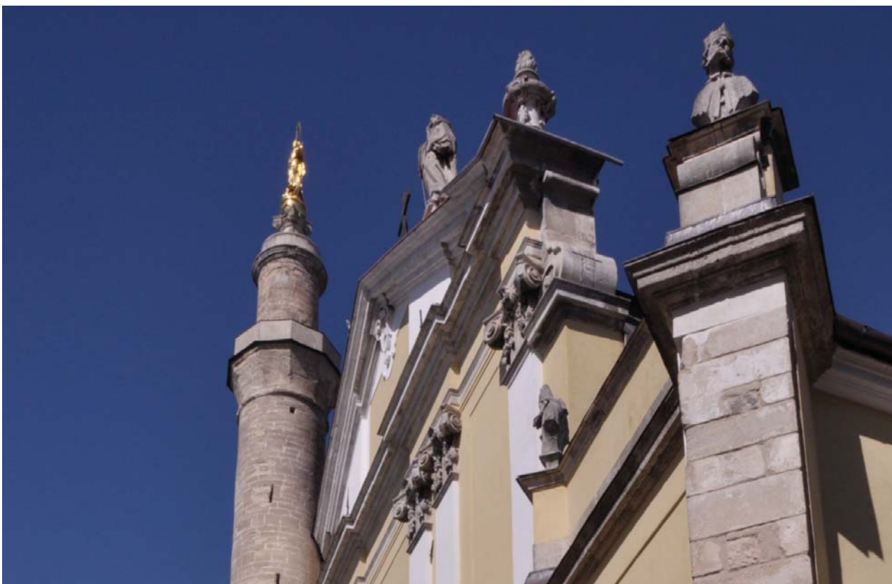
Il. 5. Katedra Piotra i Pawła w Kamieńcu Podolskim.

Ill. 5. The Cathedral church of Saint Peter and Paul in Kamieniec Podolski.