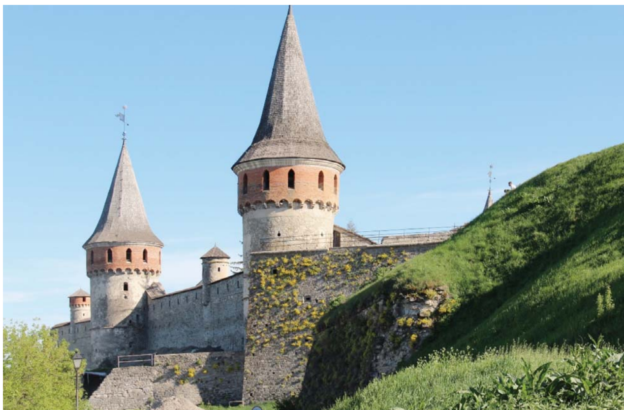
Il. 4. Stary Zamek w Kamieńcu Podolskim.