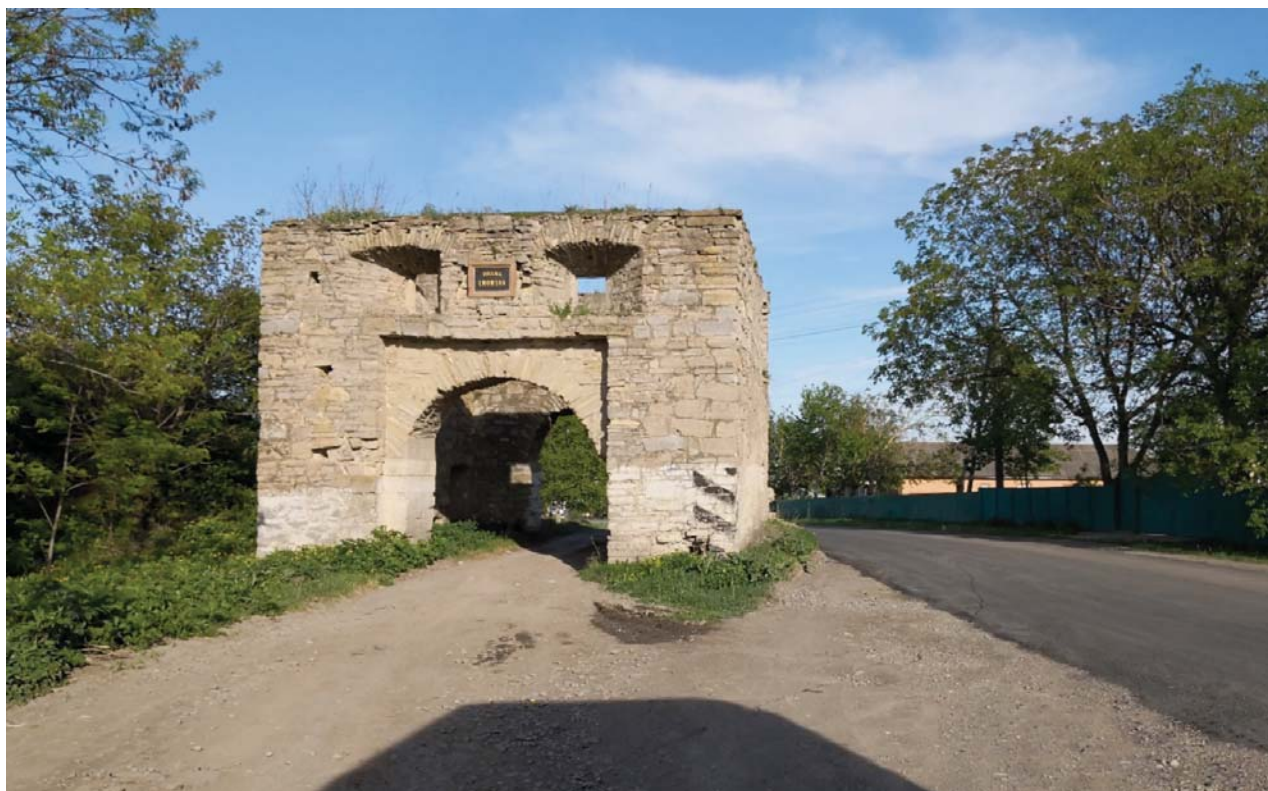
Il. 3. Pozostałości fortyfikacji Okopów Świętej Trójcy.