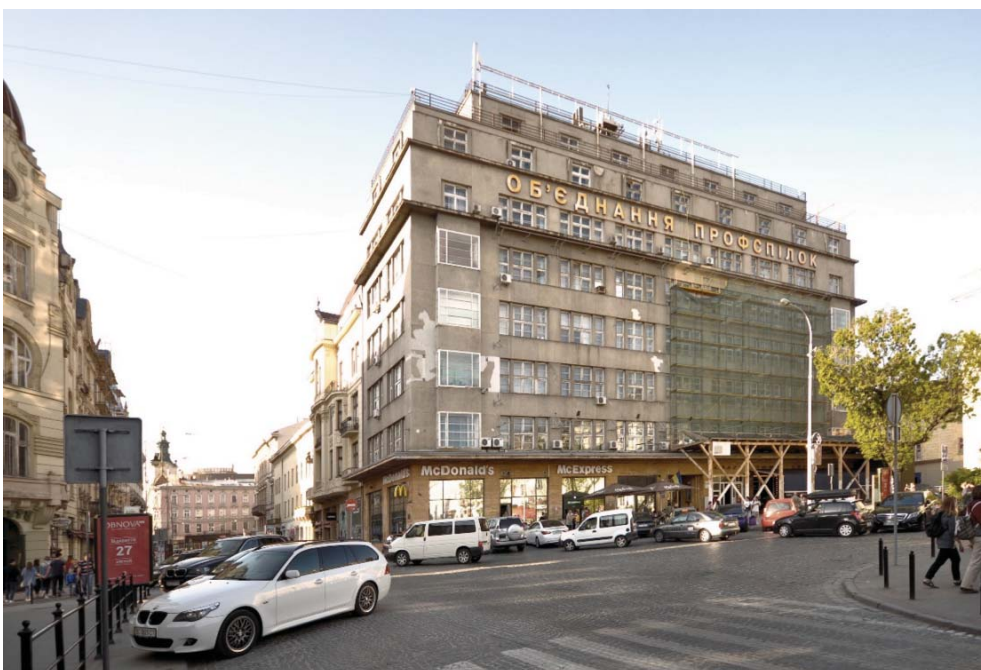
Il. 11. Gmach biurowca Sprechera przy ulicy Akademickiej 7, obecnie ulicy Szewczenki 7.

III. 10. City Hall in Stanislawow. Rebuilt in the mainstream of modernism in the 1930's, with noticeable influences of expressionism, art-deco and the Cracow School of crystal architecture.