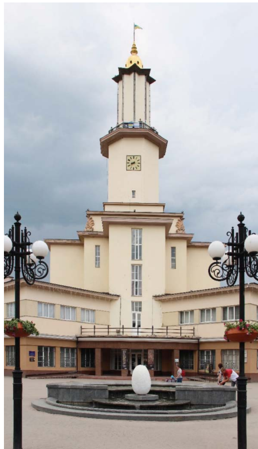
Il. 10. Ratusz w Stanisławowie. Przebudowany w nurcie modernizmu lat trzydziestych XX wieku, z zauważalnymi wpływami ekspresjonizmu, art-deco i krakowskiej szkoły architektury kryształkowej (fot. Maciej Złowodzki).

III. 9. The building of the Prague Bank in Lviv, realized in the years 1911–1912 (photo: Katarzyna Zawada-Pęgiel).