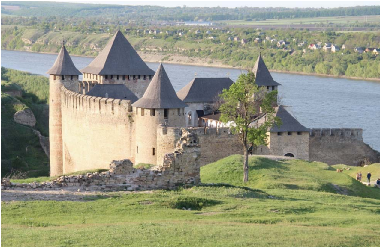
Il. 6. Twierdza Chocim (fot. Katarzyna Zawada-Pęgiel).

Ill. 5. The Cathedral church of Saint Peter and Paul in Kamieniec Podolski (photo: Katarzyna Zawada-Pęgiel).