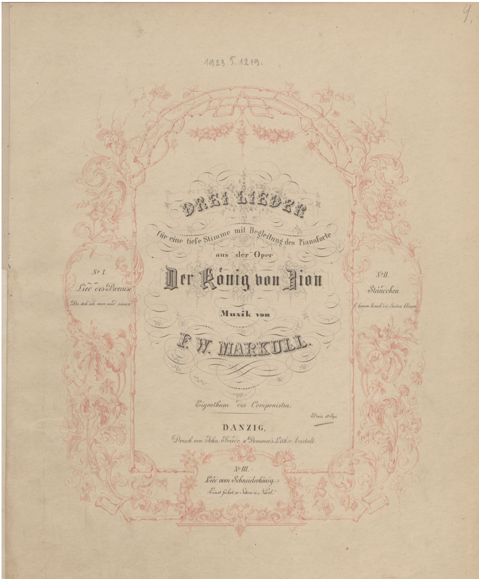
2. F.W. Markull, Drei Lieder für eine tiefe Stimme mit Begleitung des Pianoforte aus der Oper Der König von Zion , Danzig [ok. 1850] (PAN Biblioteka Gdańska, sygn. Ee 1562 4° adl. 9)