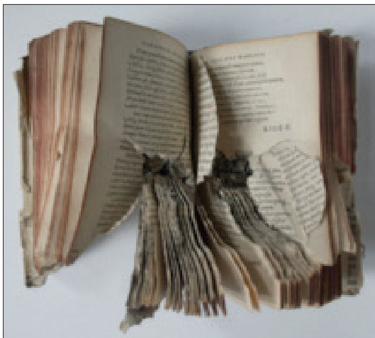
11. Stary druk ze zbiorów Biblioteki Miejskiej przestrelony w Malborku w 1945 roku Johannes Maior, In psalmos Davidis regis ac prophetae paraphrasis heroicis versibus expressa , Wittenberg 1574