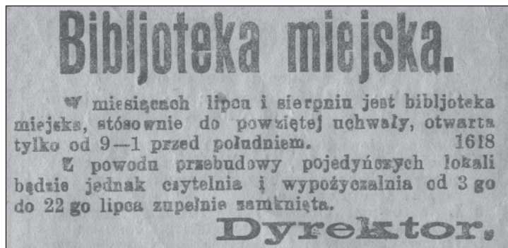
6. Informacja o letnich godzinach otwarcia Biblioteki Miejskiej w 1920 roku „Gazeta Gdańska” 1 lipca 1920 roku, nr 148, s. [3] (PAN Biblioteka Gdańska)