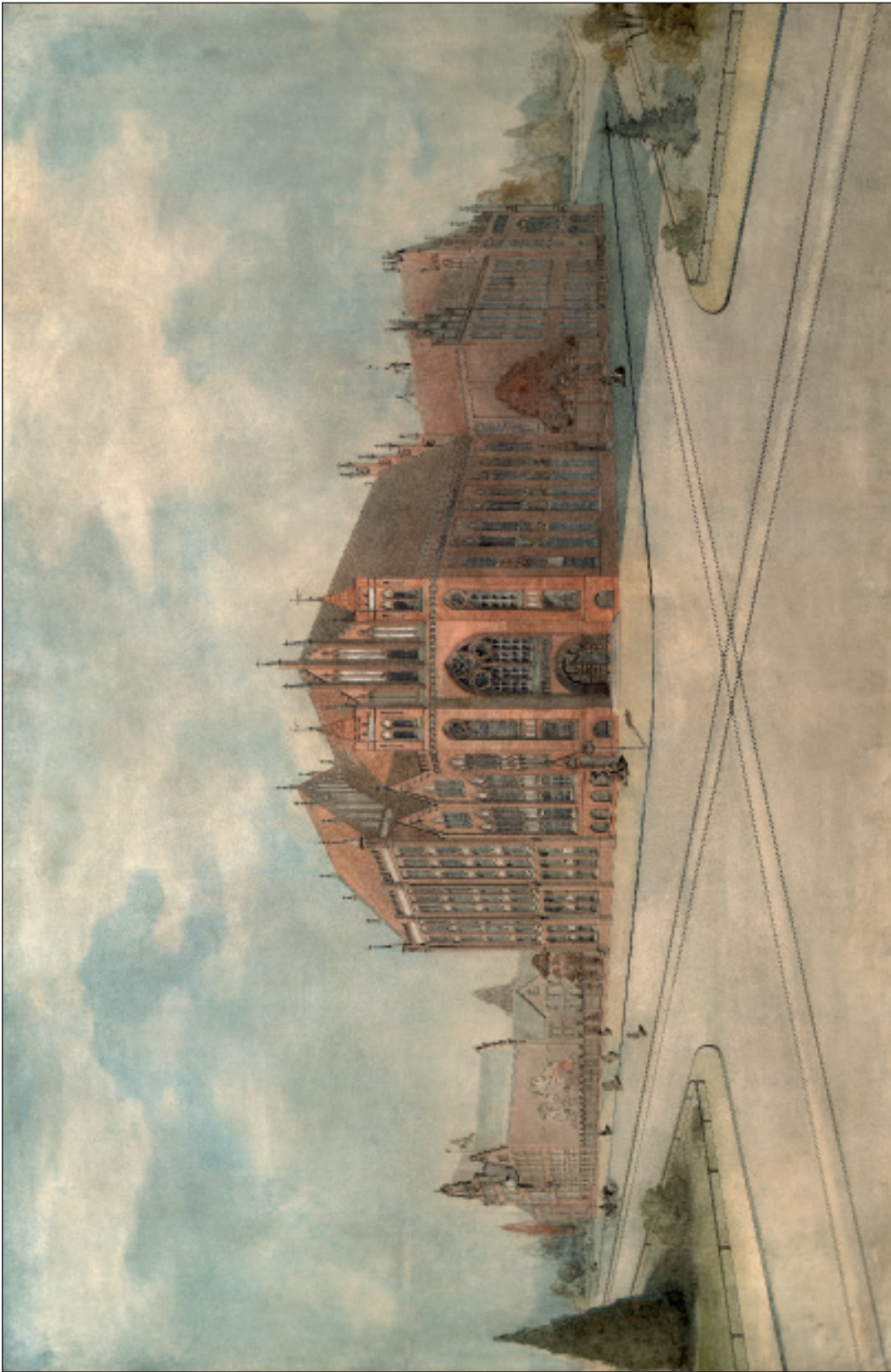
1. Karl Kleefeld, Projekt budynku Biblioteki Miejskiej w Gdańsku, 1905 rok (PAN Biblioteka Gdańska)