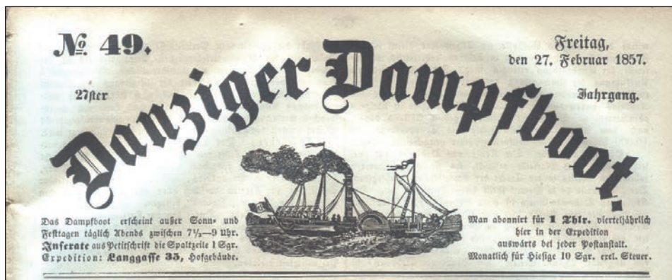
9. Winieta jednego z czasopism ze zbiorów Biblioteki Miejskiej w Gdańsku „Danziger Dampfboot für Geist, Humor, Satire, Poesie, Welt- und Volksleben, Korrespondenz, Kunst, Literatur und Theater”, nr 49 z 27 lutego 1857 roku