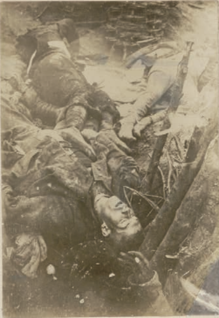
Am einem vererbten Stützpunkt in Flandern.