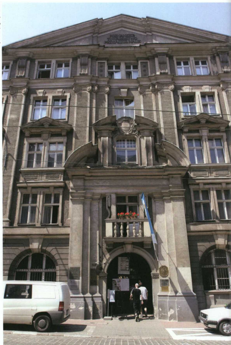
Od 1974 r. Oddział Archiwum PAN w Poznaniu mieści się w gmachu istniejącego od 1857 r. Poznańskiego Towarzystwa Przyjaciół Nauk