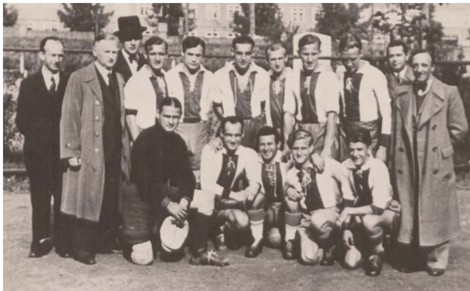
8. Zawodnicy K.S. „Gedania” – Mistrzowie Ligi Gdańskiej w 1937 roku, fot. Roman Wyrobek (PAN Biblioteka Gdańska, sygn. F II/1/1562).