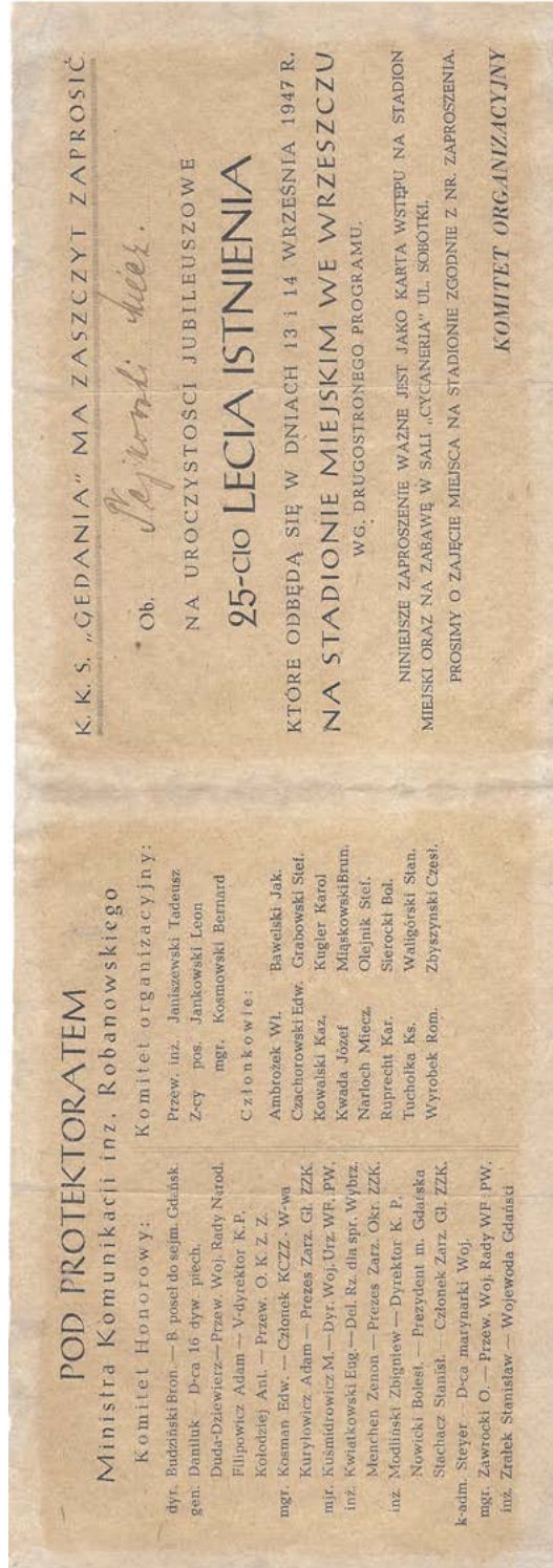
12. Zaproszenie na uroczystości jubileuszu 25-lecia istnienia K.K.S. „Gedania”, 1947 rok (PAN Biblioteka Gdańska, DŻS, brak sygnatury).