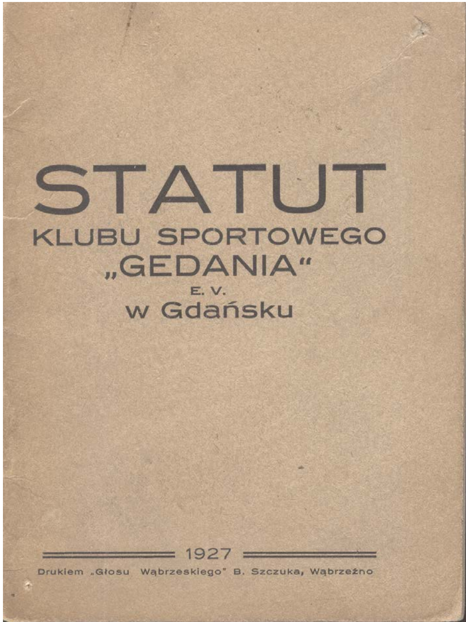
5. Statut Klubu Sportowego „Gedania” E.V. w Gdańsku, 1927 rok (PAN Biblioteka Gdańska, DZS, brak sygnatury).