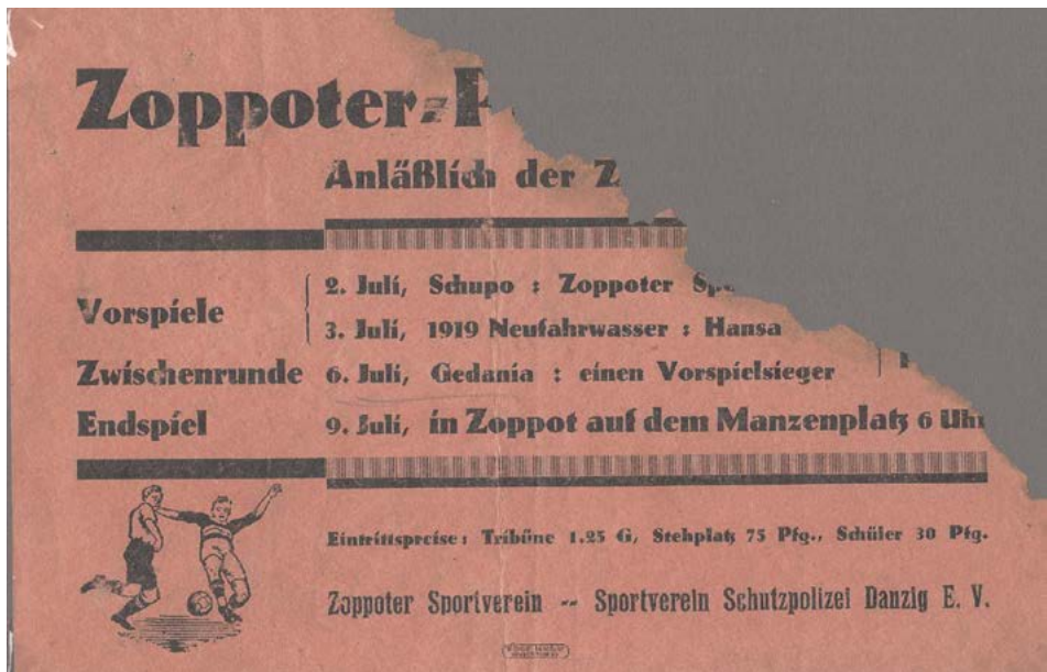
7. Ulotka z turnieju piłki nożnej z udziałem K.S. „Gedania”, 1929 rok.