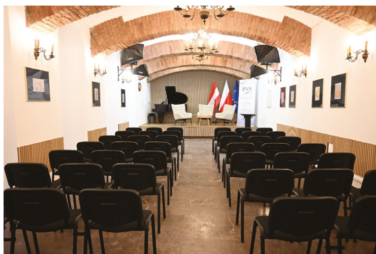
Abbildung 9 und 10. Der Jan-III-Sobieski-Saal im Wissenschaftlichen Zentrum der Polnischen Akademie der Wissenschaften in Wien nach der Renovierung.