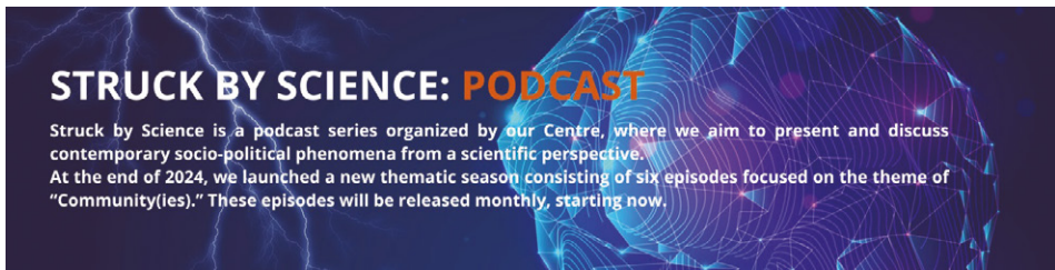
Abbildung 7. Podcast „Struck by Science“.