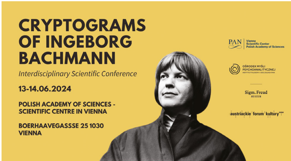
Abbildung 5: Einladung zur Konferenz „Cryptograms of Ingeborg Bachmann“.

anhand des „Allgemeinen Reichsgesetz- und Regierungsblatts für das Kaiserthum Österreich“ die Übersetzungen ausgewählter Begriffe ins Polnische und ins Ruthenische, wobei die Übersetzung deutscher Verbformen und Funktionsverbgefüge im Zentrum seines Interesses steht.