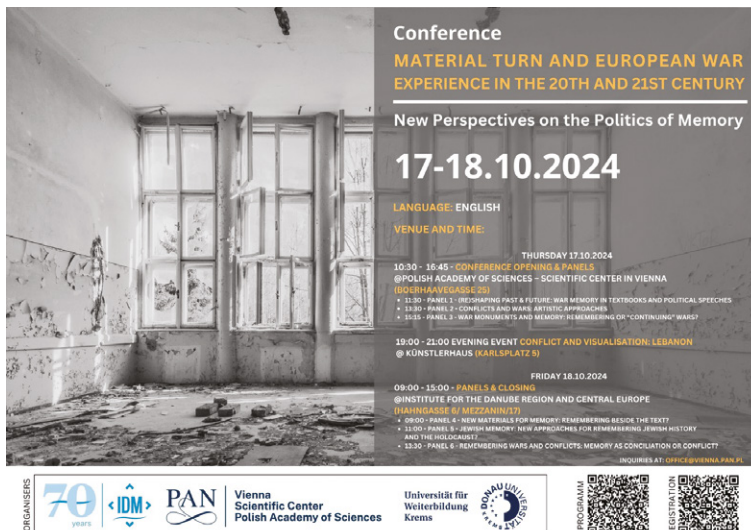
Abbildung 4. Einladung zur Konferenz „Material Turn and European War Experience in the 20 th and 21 st Century. New perspectives on the Politics of Memory.“

Für Gemeinschaften und Gesellschaften ist auch deren Umgang mit der Vergangenheit identitätsstiftend. Daher hat die Erinnerungskultur für das kollektive Gedächtnis einer Gesellschaft einen wichtigen Stellenwert inne, was insbesondere für das schmerzvolle Erinnern und Gedenken an unfassbares menschliches Leid gilt. Kriegerische Auseinandersetzungen hinterlassen nicht nur physische Zerstörung, sondern auch tiefgreifende soziale und psychologische Spuren, die über Generationen hinweg fortbestehen. Gesellschaften gedenken ihrer Vergangenheit auf unterschiedliche Art und Weise, was auch viel über deren jeweilige Verfasstheit aussagt. Im Zentrum der Konferenz „Material Turn and European War Experience in 20 th and 21 st Century. New Perspectives on politics of Memory“ in der Zeit von 17. bis 18. Oktober 2024 standen ausgewählte Aspekte von Erinnerung und Gedenken. Ein Hauptziel der Konferenz war es, europäische Erfahrungen im Kontext der Entwicklung von Erinnerungspolitiken aufzuzeigen, wobei ein besonderer Schwerpunkt auf dem in den letzten Jahren erfolgten material turn lag. Organisiert wurde die Konferenz vom Wissenschaftlichen Zentrum der Polnischen Akademie der Wissenschaften in Wien, dem Institut für den Donauraum und Mitteleuropa sowie der Universität für Weiterbildung Krems.