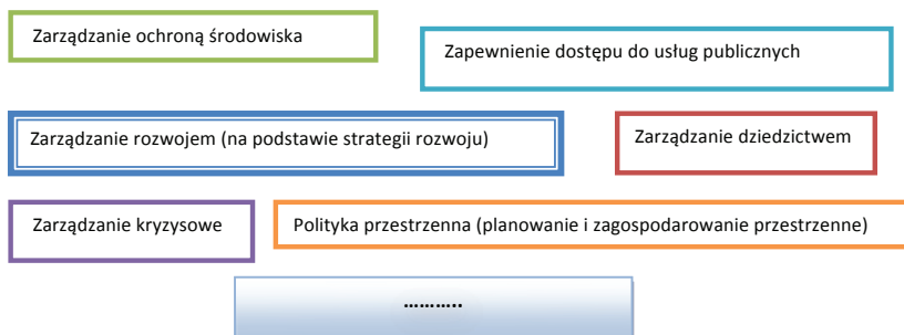
Ryc. 2A. Zarządzanie dziedzictwem w modelu rozproszonym