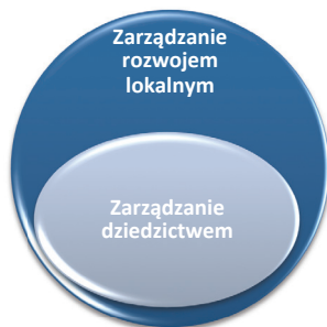
Ryc. 2B. Zarządzanie dziedzictwem jako spójny element zarządzania rozwojem

Zgodnie z zalecaniem [NID 2009] w pracach nad GPOZ można wskazać następujące fazy (etapy):