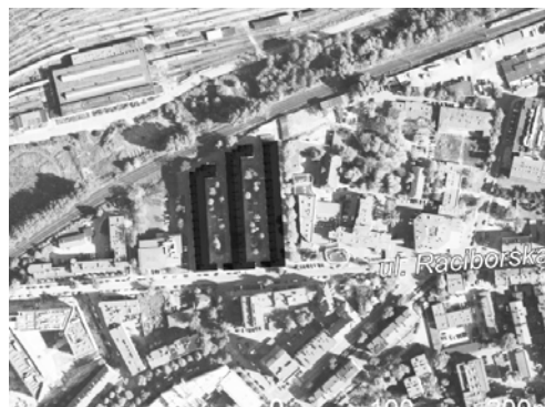
Ryc. 2. Kolonia urzędnicza przy ul. Raciborskiej – sytuacja