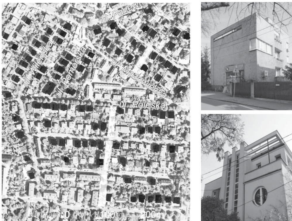
Ryc. 7. Kolonia urzędnicza w Ligocie – sytuacja

Fot. 7. Dom dr. Wł. Kowala przy ul. Mazowieckiej 16 (1936-1937)