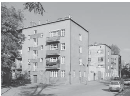
Fot. 1. Kolonia urzędnicza przy ul. Raciborskiej (Lucjan Sikorski, Tadeusz Łobos 1928)