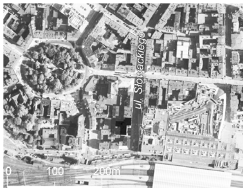
Ryc. 3. Dom profesorów Śląskich Technicznych Zakładów Naukowych – sytuacja