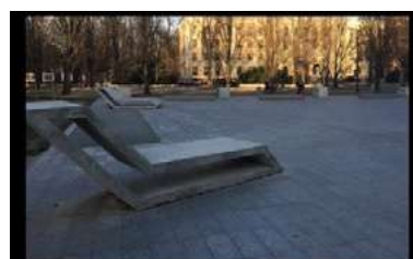
Ryc. 19. Zdjęcia przestrzeni publicznej - Lublin