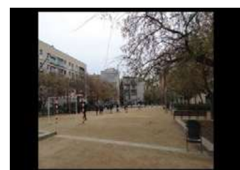
Ryc. 16. Zdjęcia zabudowy wielorodzinnej – Barcelona, autor Wojciech Kocki