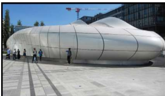
Ryc. 29. Zdjęcia pawilonu wystawowego - Paryż, autor Wojciech Kocki

Jednym z wielu przykładów jest tymczasowy pawilon wystawowy autorstwa pracowni projektowej Zaha Hadid fot. 19, 20. Jest to obiekt w którym zarówno zewnętrzna elewacja jak i wnętrze posiadają swobodne, obłe, zaokrąglone kształty będąc alternatywnym przykładem dla obiektów z przeważającą liczbą kierunków horizontalno wertykalnych.