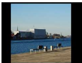
Ryc. 20. Zdjęcia przestrzeni publicznej - Kopenhaga, autor Wojciech Kocki