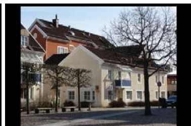
Ryc. 25. Zdjęcia zabudowy jednorodzinnej - Angelholm, Szwecja