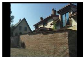
Ryc. 13. Zdjęcia zabudowy jednorodzinnej – dzielnica Konstantynów - Lublin