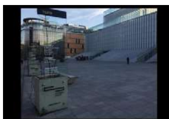
Ryc. 18. Zdjęcia przestrzeni publicznej - Lublin, autor Wojciech Kocki