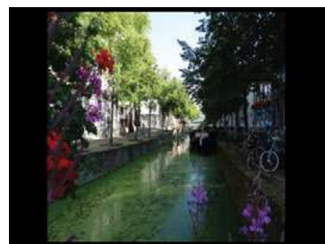
Ryc. 28. Zdjęcia zabudowy jednorodzinnej – Delft, Holandia, autor Wojciech Kocki

Opisane przestrzenie posiadają całkowicie odmienny charakter a ich percepcja zależy od skali zabudowy, ilości zieleni, łatwości w sprecyzowaniu swojej lokalizacji do np. centrum miasta, scenariusza zachowań oraz możliwości wykorzystania tych przestrzeni w zależności od pory dnia i dostępnych usług. Ważnym elementem przy wyborze przestrzeni mieszkalnych jest niemal wyłącznie status ekonomiczny mieszkańca. [11] Wszystkie te aspekty tworzą zbiór cech pośrednio wpływających na samopoczucie i stan emocjonalny człowieka.