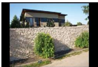
Ryc. 11. Zdjęcia zabudowy jednorodzinnej – dzielnica Wola Justowska - Kraków, autor Wojciech Kocki

Coraz częstszym rozwiązaniem jest widoczne na fot. 1,2,3 ogrodzenie w formie pełnego muru uniemożliwiający kontakt wzrokowy pomiędzy strefą prywatną właściciela działki z domem a przestrzenią publiczną ulicy osiedla. Takie rozwiązanie formalne ogrodzenia uniemożliwia również tworzenia się stref półpublicznych i półprywatnych. [10] Dążenie do całkowitej prywatności oraz oddzielenia swojej przestrzeni od wspólnej może być jednym z wymiernych bodźców psychologicznych w percepcji środowiska mieszkalnego.