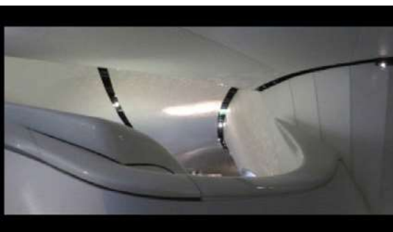
Ryc. 30. Zdjęcia pawilonu wystawowego - Paryż, autor Wojciech Kocki

Parametrycznie zaprojektowana przestrzeń A fot. 21,22 jest jednym z przykładów form, które przy wykorzystaniu dostępnych narzędzi programowych mogą kształtować przestrzeń w sposób odmienny niż konwencjonalne projekty.