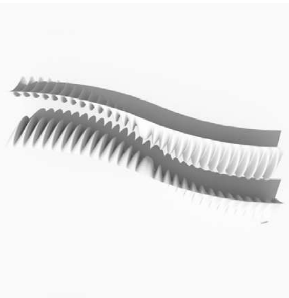
Ryc. 32. Parametrycznie zaprojektowana przestrzeń A – widok z góry, autor Wojciech Kocki