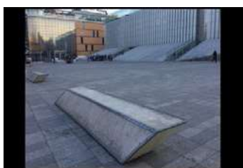
Ryc. 17. Zdjęcia przestrzeni publicznej - Lublin

Kolejnym przykładem miejsc posiadających zbiór cech związanych z percepcją przestrzeni posiadającej odmienny charakter, wspólnej, są miejsca będące otoczeniem obiektów dużej skali jak teatry, muzea, opery, obiekty sztuki i kultury. Otwarta przestrzeń, będąca zarówno tłem jak i dopełnieniem obiektu architektury, jest nieformalna i zazwyczaj nie posiada precyzyjnego scenariusza jej użytkowania. Fot 7 – 12.