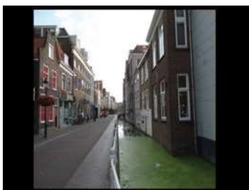
Ryc. 26. Zdjęcia zabudowy jednorodzinnej – Delft, Holandia, autor Wojciech Kocki