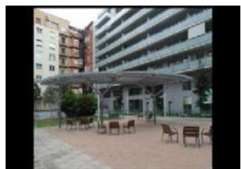
Ryc. 14. Zdjęcia zabudowy wielorodzinnej – Barcelona