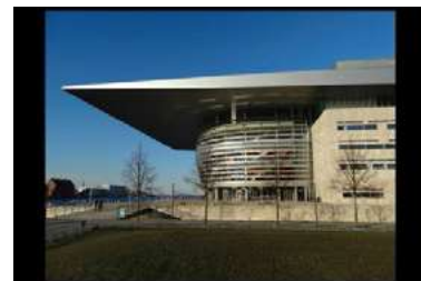
Ryc. 22. Zdjęcia przestrzeni publicznej - Kopenhaga, autor Wojciech Kocki

Miejskie przestrzenie niewielkich miast, kameralne zaułki ulic wśród historycznej zabudowy są bardzo bliskie człowiekowi ze względu na swoją skalę zabudowy. Człowiek przemierzając te przestrzenie nie jest przytłoczony wysokimi obiektami których percepcja nie jest jednoznacznie możliwa z jednego punktu widokowego. Ulice miasteczek takich jak Angelholm fot. 13-15 lub Delft fot. 16 -18 umożliwiają dobrą orientację oraz lokalizację widza w stosunku do całego miasta poprzez charakterystyczne dominanty urbanistyczne tj. kościoły, ratusze itp.