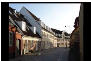
Ryc. 24. Zdjęcia zabudowy jednorodzinnej - Angelholm, Szwecja, autor Wojciech Kocki