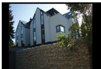
Ryc. 12. Zdjęcia zabudowy jednorodzinnej – dzielnica Wola Justowska - Kraków, autor Wojciech Kocki