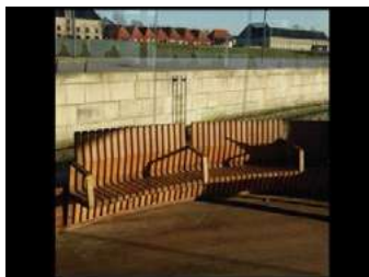
Ryc. 21. Zdjęcia przestrzeni publicznej - Kopenhaga