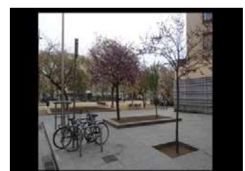
Ryc. 15. Zdjęcia zabudowy wielorodzinnej – Barcelona, autor Wojciech Kocki