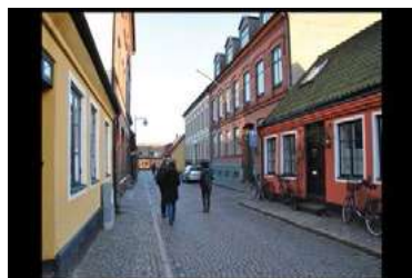
Ryc. 23. Zdjęcia zabudowy jednorodzinnej - Angelholm, Szwecja

Miejskie przestrzenie niewielkich miast, kameralne zaułki ulic wśród historycznej zabudowy są bardzo bliskie człowiekowi ze względu na swoją skalę zabudowy. Człowiek przemierzając te przestrzenie nie jest przytłoczony wysokimi obiektami których percepcja nie jest jednoznacznie możliwa z jednego punktu widokowego. Ulice miasteczek takich jak Angelholm fot. 13-15 lub Delft fot. 16 -18 umożliwiają dobrą orientację oraz lokalizację widza w stosunku do całego miasta poprzez charakterystyczne dominanty urbanistyczne tj. kościoły, ratusze itp.