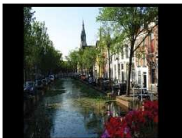
Ryc. 27. Zdjęcia zabudowy jednorodzinnej – Delft, Holandia, autor Wojciech Kocki