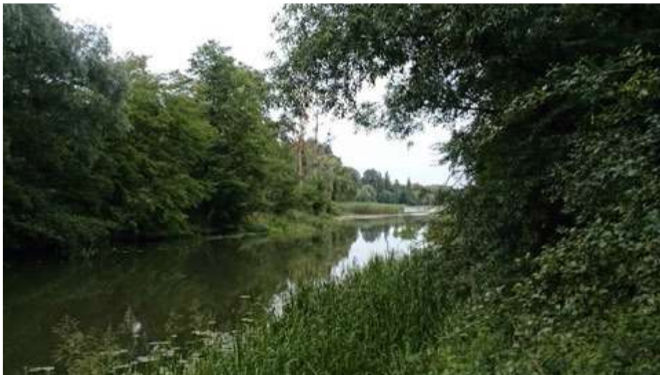
Ryc. 5. Ryc. 5. Tereny dawnego kąpieliska Ohle Strandbad we Wrocławiu. Paradoksalnie teren dawnego kąpieliska porzuconego w wyniku zanieczyszczenia wód powierzchniowych i rozebranego ma bogatszą szatę roślinną niż w okresie do 1945 roku. Nieuporządkowane formy zieleni przesłaniają zdegradowaną przestrzeń miejską. Stan w maju 2015 roku. Autor S. Wróblewski.