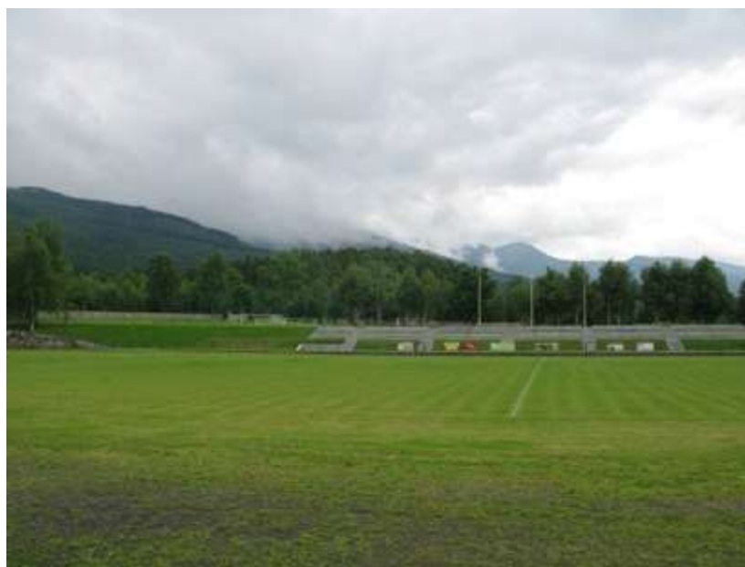
Ryc. 6. Ryc.6. Kowary zespół sportplatzu łączący cechy założenia górskiego (panorama okolic) z typowym założeniem o liniowej kompozycji. Zieleń obecna pochodzi z powojennych nasadzeń, rzadko uzupełniana po 1945 roku, w układach swobodnej zieleni obrzeżnej. Widoczny jest brak czytelnej wizji projektowej obecnej w poprzednim układzie. Stan w czerwcu 2015 r.