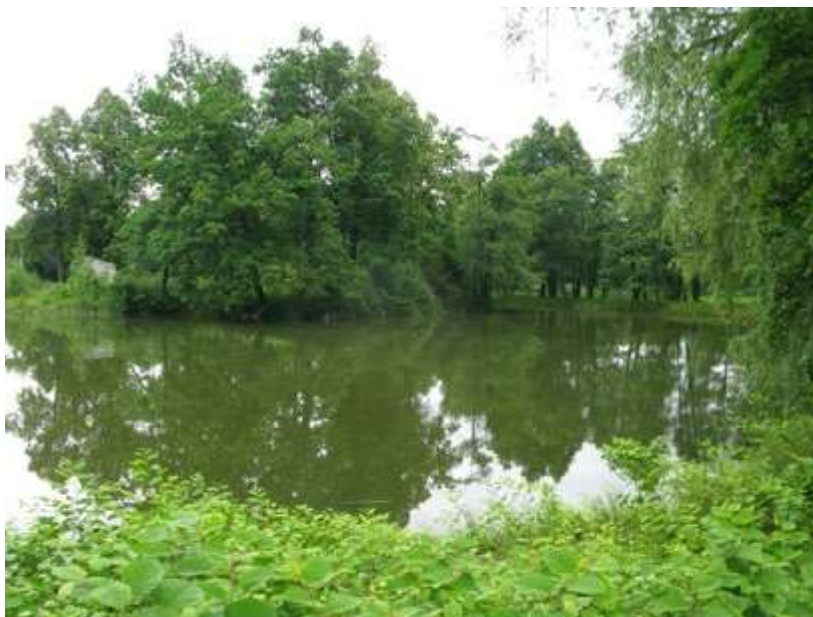
Ryc. 7. Ryc. 7 Kowary – układ dawnego kąpieliska miejskiego o charakterze parkowym, łączącego cechy inselbadu i kąpieliska górskiego bergbadu, zamkniętego po zanieczyszczeniu wód naturalnego zbiornika. Zielen zaniedbana, w dużej mierze z przypadkowych nasadzeń po 1945 roku tworzy rodzaj opuszczonego parku. Stan w czerwcu 2015 r. Autor S. Wróblewski.