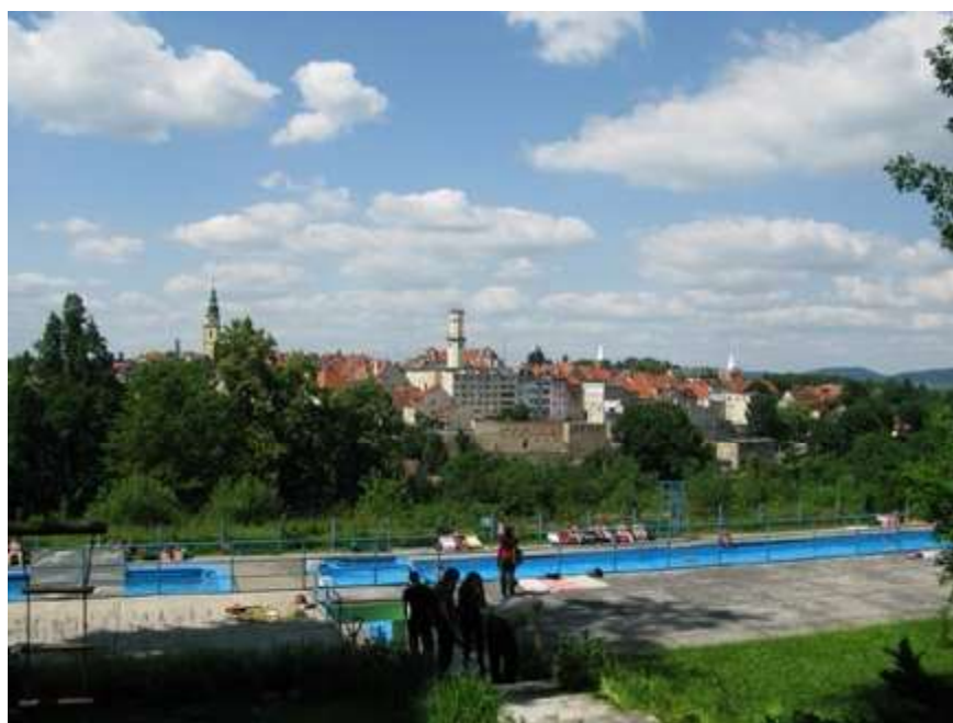
Ryc. 8. Ryc.8. Wciąż działające, jedno z niewielu zachowanych kąpielisk górskich w Bystrzycy Kłodzkiej. Swobodnie rosnąca zielen przy braku kontroli zagraża podstawowemu walorowi kąpieliska, jakim był widok na spektakularną panoramę miasta. W obrębie zespołu przypadkowe układy zieleni z nasadzeń po 1945 r. również zaburzają pierwotną kompozycję projektową kompleksu. Stan w lipcu 2013 r.