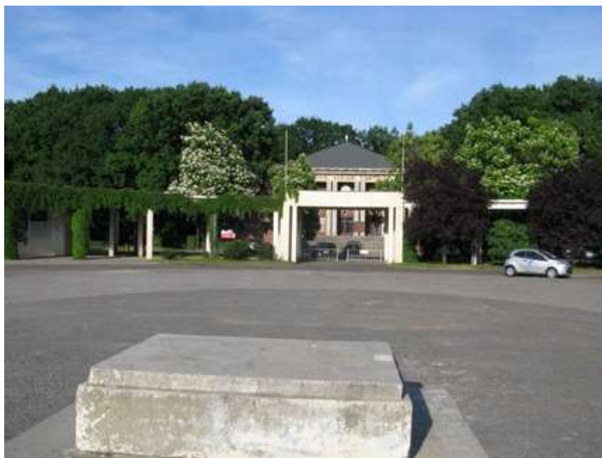
Ryc. 4. Ryc.4. Dzisiejszy wygląd placu honorowego we Wrocławskim Parku Sportowym Zalesie. Zielen parkowa sukcesywnie uzupełniana po 1945 roku, w formie zieleni parkowej, z widocznymi zaniedbaniami. Część szpalerów prowadzących do placu została zniekształcona, podobnie jak i formy zieleni towarzyszącej. Zespół ma zostać poddany pracom rewitalizacyjnym. Stan w czerwcu 2015 r.