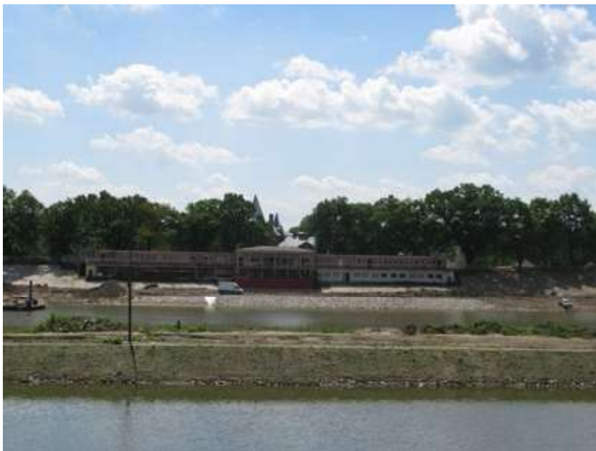
Ryc. 3. Ryc.3. Dawne kąpielisko Nordbad we Wrocławiu, zlikwidowane w wyniku zanieczyszczenia wód rzecznych. Zachowana została, choć znacznie przekształcona, architektura zespołu oraz zielen szpalerowa wzdłuż drogi, stanowiąca tło dla dawnego zespołu kąpieliska. Całkowicie zniszczona została zielen niska i kompozycja na terenie zalewowym. Obecnie teren pozbawiony zieleni. (stan w maju 2015 r. ) Autor S. Wróblewski.