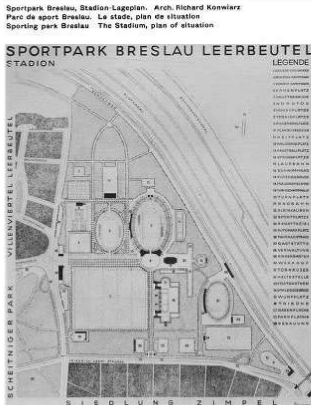
Ryc. 1. Projekt Sportpark Breslau Leerbeutel w: Brandt K., Konwiarz R., Deutscher Sportbau = Constructions Sportives Allemandes = German Sporting Constructions", Deutschen Reichsausschuss für Leibesübunge, Berlin 1930 Str. 37.

wypada na niekorzyść obecnie realizowanych zespołów sportowych, obrazując, w jaki sposób wyższa kultura sportowa została zastąpiona mniej wartościowym sposobem planowania.