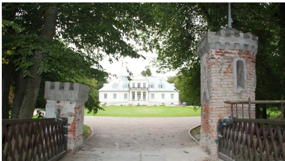
Ryc.4. Eklektyczna brama wjazdowa, w tle pałac rodziny Kraszewskich.

Fig. 3. Eclectic gate, in the background palace of Kraszewski family.