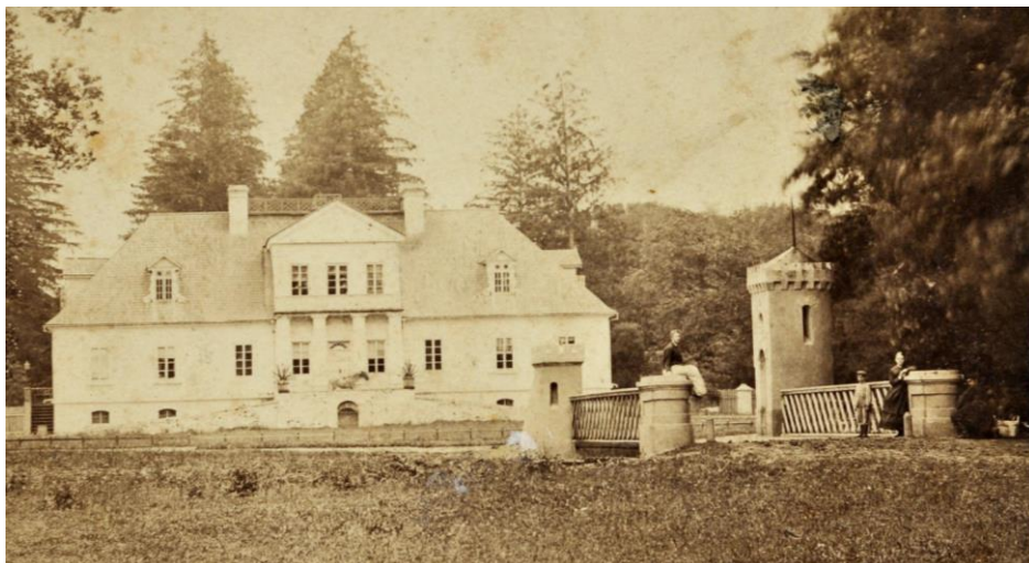
Ryc.3. Eklektyczna brama wjazdowa, w tle pałac rodziny Kraszewskich I połowa XIX w., zbiory Muzeum Józefa Ignacego Kraszewskiego w Romanowie

Fig. 3. Eclectic gate, in the background palace of Kraszewski family. Source: The Museum Jozef Ignacy Kraszewski in Romanow