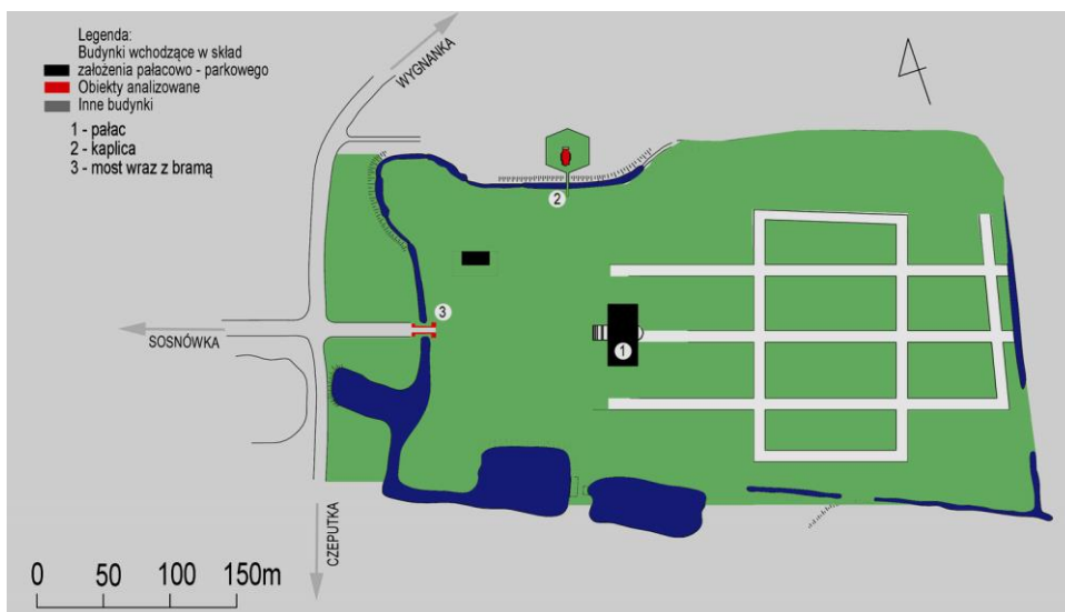
Ryc.7. Romanów, schemat planu zespołu pałacowo - parkowego w obecnych granicach. Oprac. autor Fig.7. Romanow, schematic plan of the palace - park complex (current borders). Prepared by author

Obecnie park, o oryginalnym układzie przestrzennym, posiada powierzchnię trzech hektarów. Wśród gatunków drzew przeważających największy udział mają Fraxinus Excelsior , Alnus glutinosa , Acer platanoides oraz Robinia pseudoacacia . 14