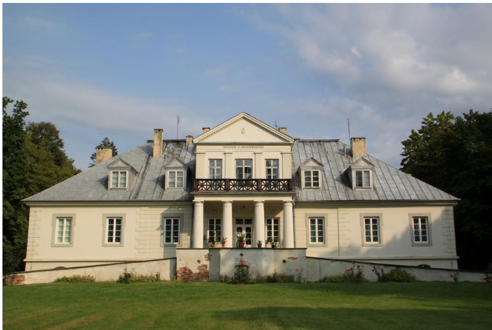
Ryc.1. Pałac w zespole rezydencjonalnym w Romanowie. Fot. autor, (2011) Fig.1. The building of palace in Romanow complex. Photo by author, (2011)