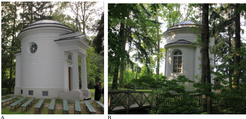
Ryc.8. Romanów, widok na kaplicę, a – kaplica pałacowa. (2011), b - stan w roku 2010 – widok od strony parku.

Fig.8. Romanow, views of the chapel, a - the palace chapel, (2011) b - - the view from the park. (2010)