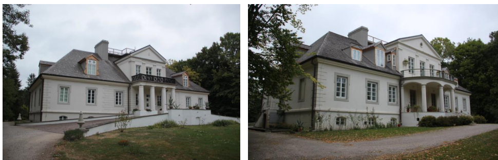
a b Ryc.2. Romanów, a -fasada pałacu po restauracji, b-elewacja ogrodowa pałacu po restauracji . Fig.2. Romanow a- facade of the palace after rehabilitation, b-garden elevation of palace after rehabilitation.