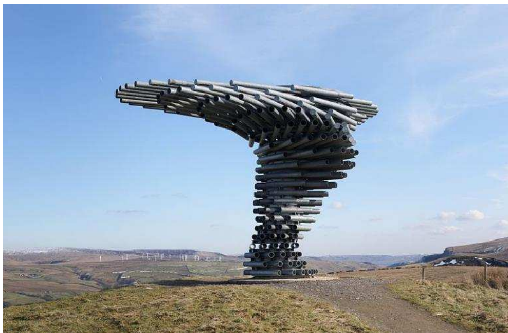
Ryc. 1. Singing Ringing Tree w Lancashire w Wielkiej Brytanii autorstwa Mike'a Tonkin'a i Anny Liu.