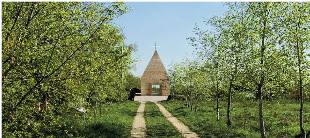
Ryc. 2. Votum Aleksa w Tarnowie, autorstwa pracowni projektowej "Beton". Fig. 2. Alex's Votum chapel in Tarnów, Poland. Author: "Beton" design studio.