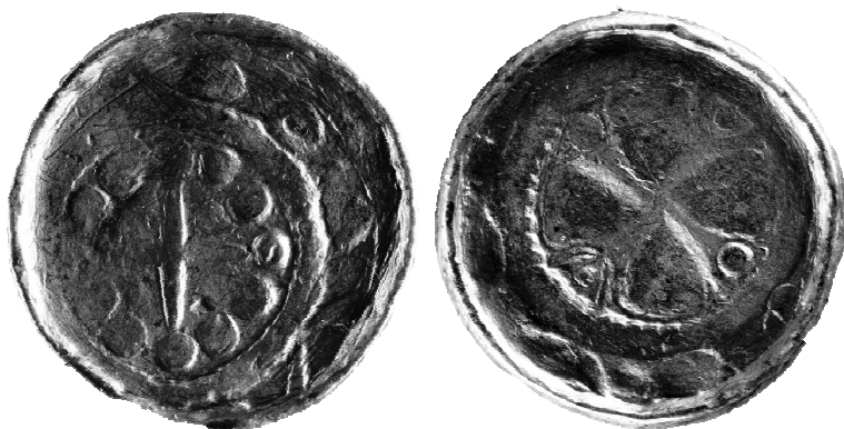
Ryc. 9. Denar krzyżowy z grobu nr 42 (MNKi)

Denar krzyżowy, typ CNP V, odm. 619, lata 1050–1075.