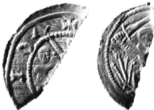
Ryc. 10. Ok. \frac{1}{3} denara Władysława II Wygnańca z grobu nr 43 (MNKi)

Ok. \frac{1}{3} denara księcia Polski Władysława II Wygnańca typu 1, ok. 1138–1140 r., men. Kraków 18 .