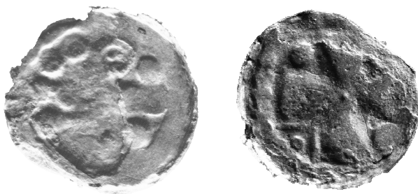
Ryc. 3. Denar krzyżowy z grobu nr 4 (MNKi)

b) denar krzyżowy, typ CNP VII, odm. 990 lub 991, lata 1075–1095 8 .