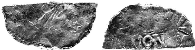
Ryc. 5. ½ denara Alberta II z grobu nr 23 (MNKi)

½ denara hrabiego Namur, Alberta II, lata 1018–1064 9 , men. Namur 10 .