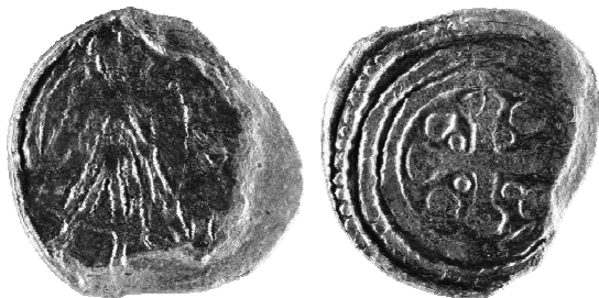
Ryc. 1. Moneta Bolesława III Krzywoustego z grobu nr 3 (MNKi)

Moneta księcia polskiego Bolesława III Krzywoustego typu 4, ok. 1125–1138 4 , men. Kraków.