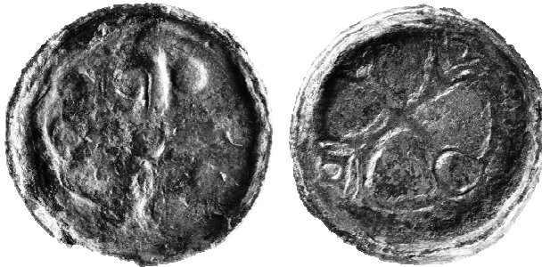
Ryc. 7. Denar krzyżowy z grobu nr 28 (MNKi)

Denar krzyżowy, typ CNP VII, odm. 986, lata 1075–1095.