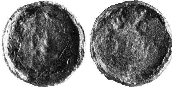
Ryc. 6. Denar krzyżowy z grobu nr 25 (MNKi)

Denar krzyżowy; z powodu zniszczenia powierzchni określenie typu jest niemożliwe, 2. połowa XI w.