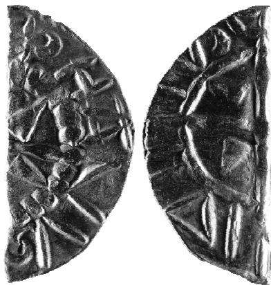
Ryc. 8. ½ obola Stefana I Świętego z grobu nr 30 (MNKi)

½ obola króla Węgier Stefana I Świętego, 1015–1038 14 , men. Białogród (węg. Székesfehérvár) lub Ostrzyhom (Esztergom).