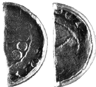
Ryc. 4. \frac{1}{2} denara krzyżowego z grobu nr 12 (MNKi)

\frac{1}{2} denara krzyżowego, typ CNP V, odm. 612–624, lata 1050–1075.