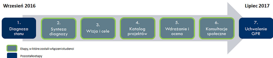
Ryc. 1. Przebieg procesu opracowywania GPR wraz z wyszczególnionymi etapami, w których uczestniczyli studenci