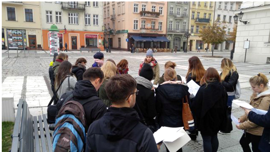
Ryc. 2. Inwentaryzacja przestrzenno-funkcyjna obszaru rewitalizacji przeprowadzona z udziałem studentów włączonych w prace nad GPR