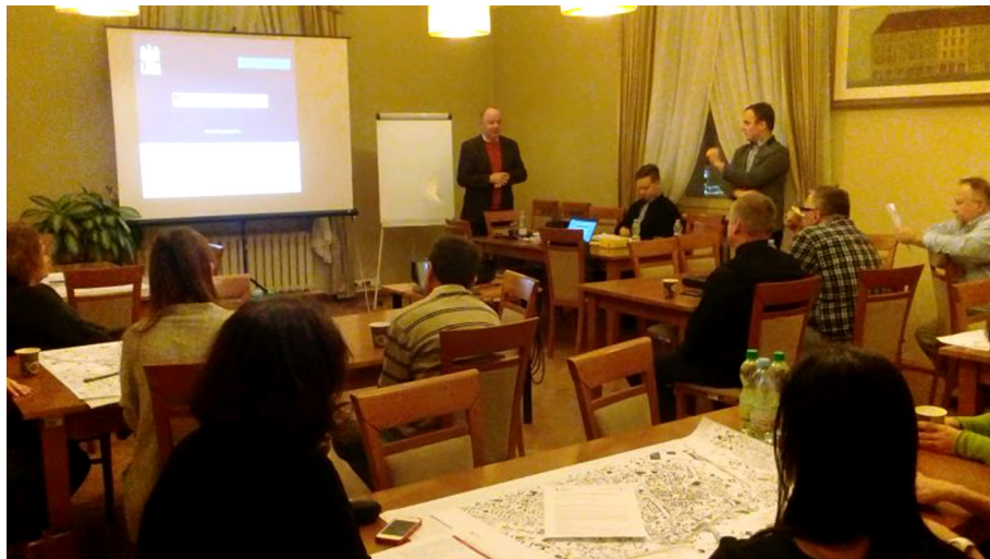
Ryc. 4. Warsztat Synteza diagnozy początkiem budowania programu