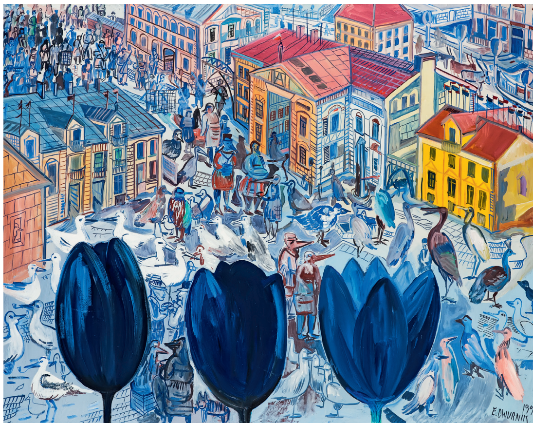
„Czarne tulipany”, 1991 r., Edward Dwurnik (1943–2018)