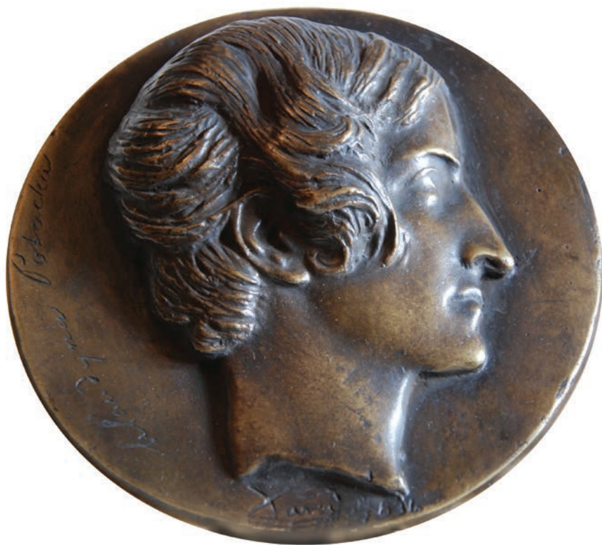
Medalion portretowy Klauđyny Potockiej autorstwa Davida d'Angers. Zbiory Biblioteki Kórnickiej.