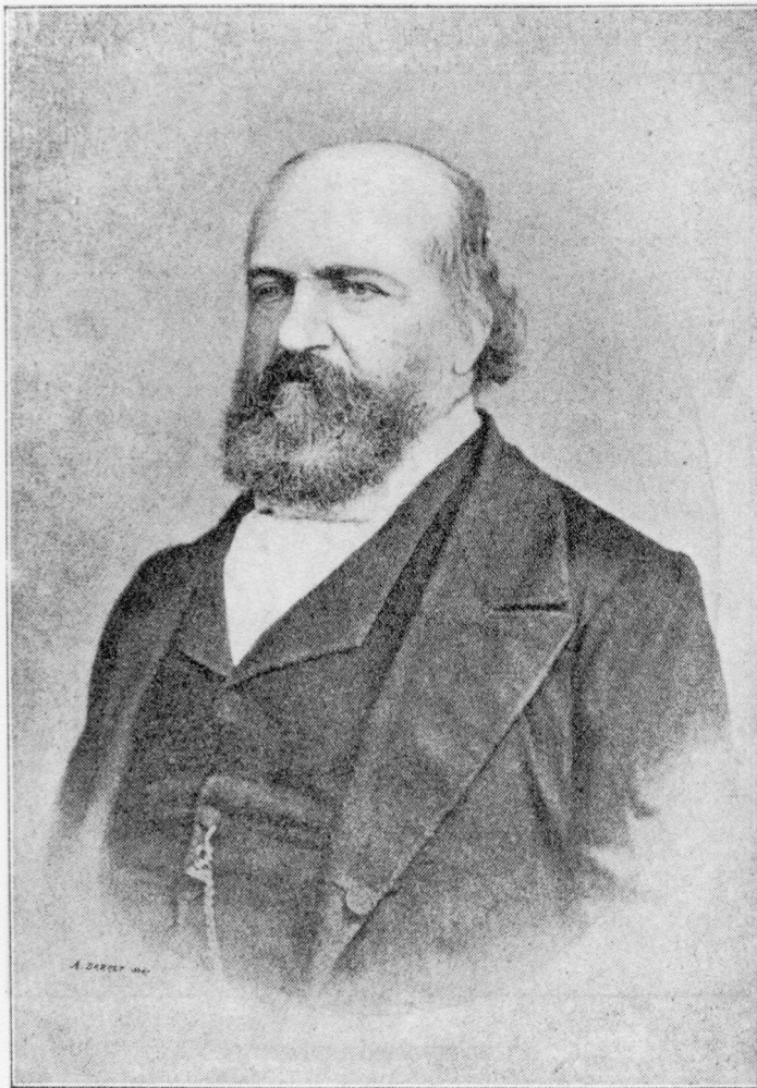
ÉLIPHAS LÉVI BARRET — 1862 —