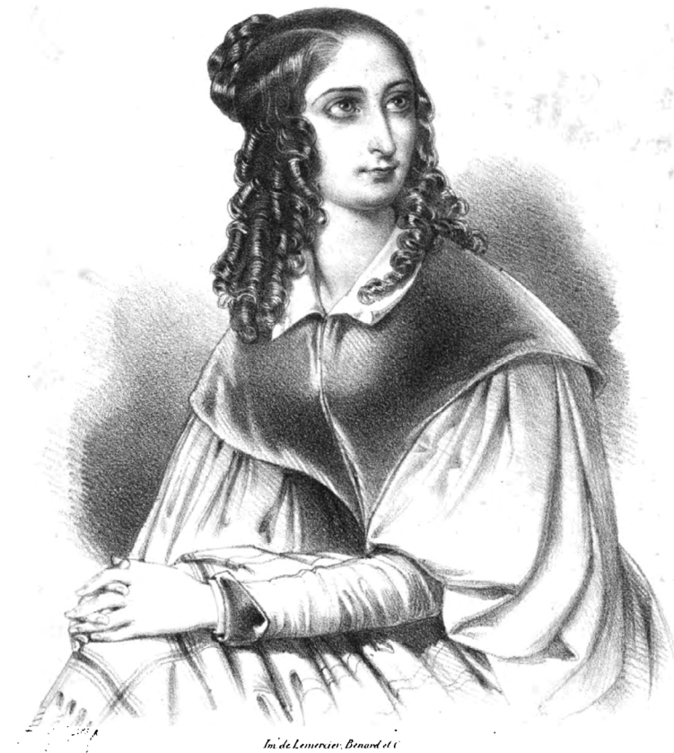
M me . Flora TRISTAN .

2. Alphonse-Louis Constant, „Flora Tristan”, ryc., [w]: „Lettres aux belles femmes de Paris et de la province”, 1840