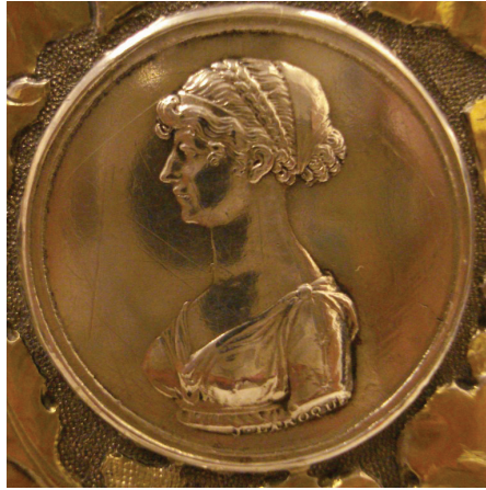
Ryc. 32. Anna Dorota Biron, księżna kurlandzka (1761–1821), żeton pamiątkowy (nr 31)