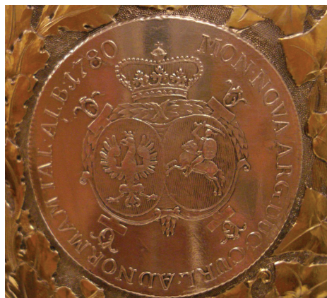
Ryc. 17–18. Kurlandia, Piotr Biron, talar 1780 (Av. nr 46, Rv. nr 24)