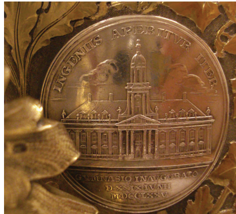
Ryc. 19–20. Piotr Biron, medal „Na inaugurację Gimnazjum w Mitawie”, 1775 (Av. nr 40, Rv. nr 17)