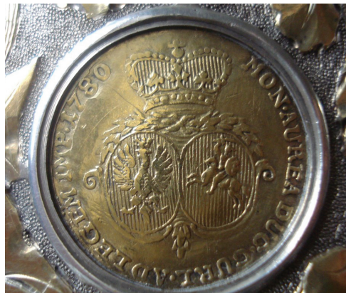
Ryc. 15–16. Kurlandia, Piotr Biron, dukat 1780 (Av. nr 2, Rv. nr 29)

Kurlandia, Piotr Biron, dukat 1780, nieokreślona mennica. Złoto, śr. 20–21 mm (ryc. 15–16).