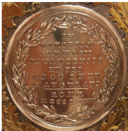
Ryc. 21–22. Piotr Biron, medal wybity w 10. rocznicę inauguracji Gimnazjum w Mitawie, 1785 (Av. nr 34, Rv. nr 22)

Kurlandia, Piotr Biron, medal na 10. rocznicę inauguracji Gimnazjum w Mitawie, 1785. Medalier C. Leberecht (1749–1827), men. Petersburg lub Rzym. Srebro, śr. 43,0 mm (ryc. 21–22).