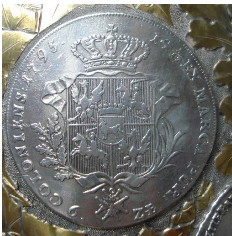
Ryc. 25. Polska, Stanisław August, talar sześćzłotowy 1795 (nr 42)

Raczyński 1843, 505; Więcek 1993, nr 24, s. 45–46. W naczyniu nr 30.