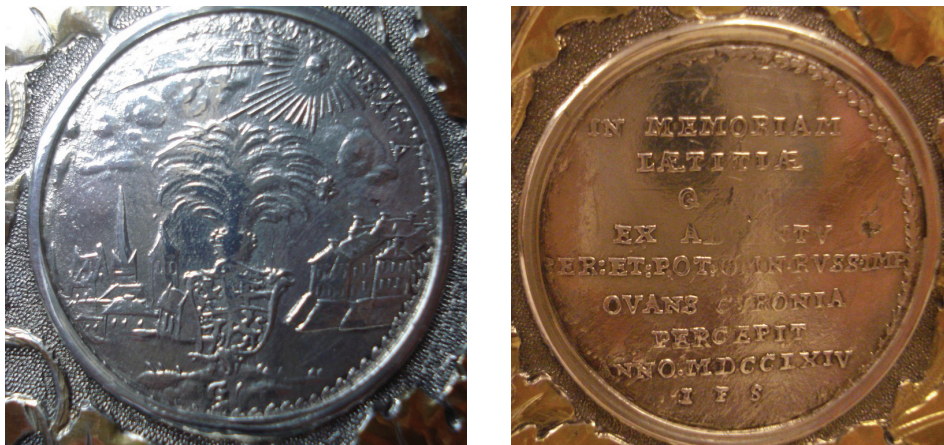
Ryc. 6–7. Ernest Jan Biron, żeton z okazji wizyty Katarzyny II w Mitawie, 1764 (Av. nr 21, Rv. nr 23)

Znane są trzy odmiany żetonu w srebrze 15 — w korpusie kufła umieszczony jest awers (nr 21) i rewers (nr 23) odmiany z I.F.S.