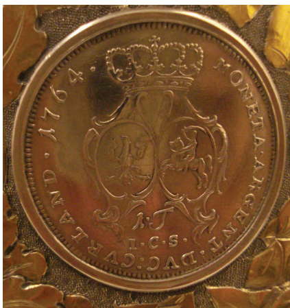
Ryc. 10. Kurlandia, Ernest Jan Biron, tynf próbny 1764, jednostronny (nr 39)

W latach 1764–1765, za panowania Stanisława Augusta, wybijane były szelągi, grosze srebrne i miedziane, trojaki, szóstaki, orty, tynfy i dukaty. W kuflu umieszczone są cztery monety z 1764 r.: w korpusie próbny tynf, na uchwycie szóstak (awers), trojak (rewers) i grosz srebrny (awers). Trojak z 1765 r., z widocznym awersem, wmontowano w uchwyt.