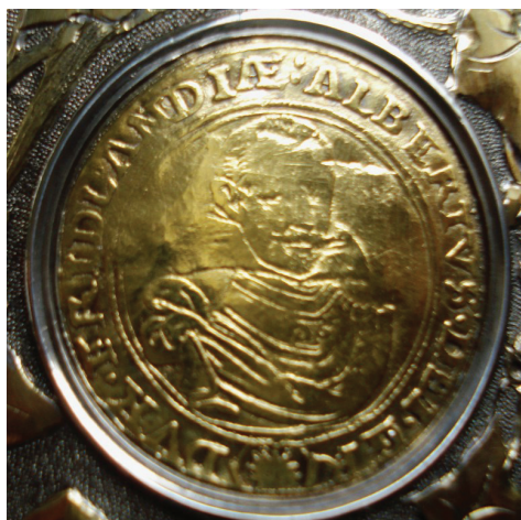
Ryc. 28. Księstwo Frýdlanckie, Albrecht Wallenstein, podwójny dukat szeroki 1627 (nr 19)

Nohejlová-Prátová 1969, Taf. I/4. W naczyniu nr 44.