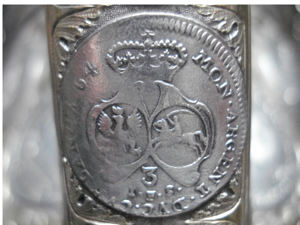
Ryc. 12. Kurlandia, Ernest Jan Biron, trojak 1764, Rv. (nr 14)