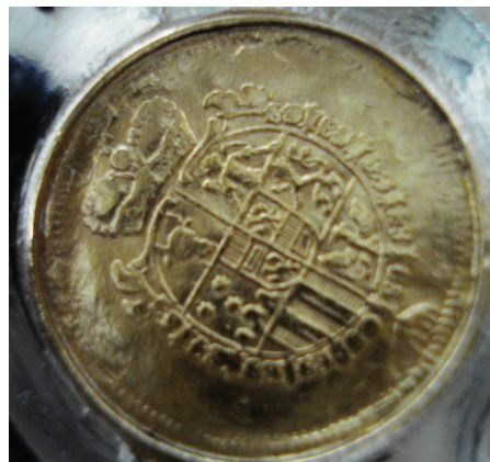
Ryc. 31. Księstwo Żagańskie, Ferdynand August z Lobkowicz, dukat niedatowany (1698–1715), (nr 4, Av. i Rv.)

Księstwo Żagańskie, Ferdynand August z Lobkowicz, dukat niedatowany (1698–1715) 39 , bez znaku mennicy (Praga?). Złoto, śr. 20 mm (ryc. 31).