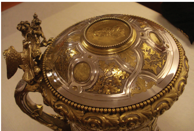
Ryc. 35. Wieko kufła księżnej Doroty z medalem Fryderyka Wilhelma III