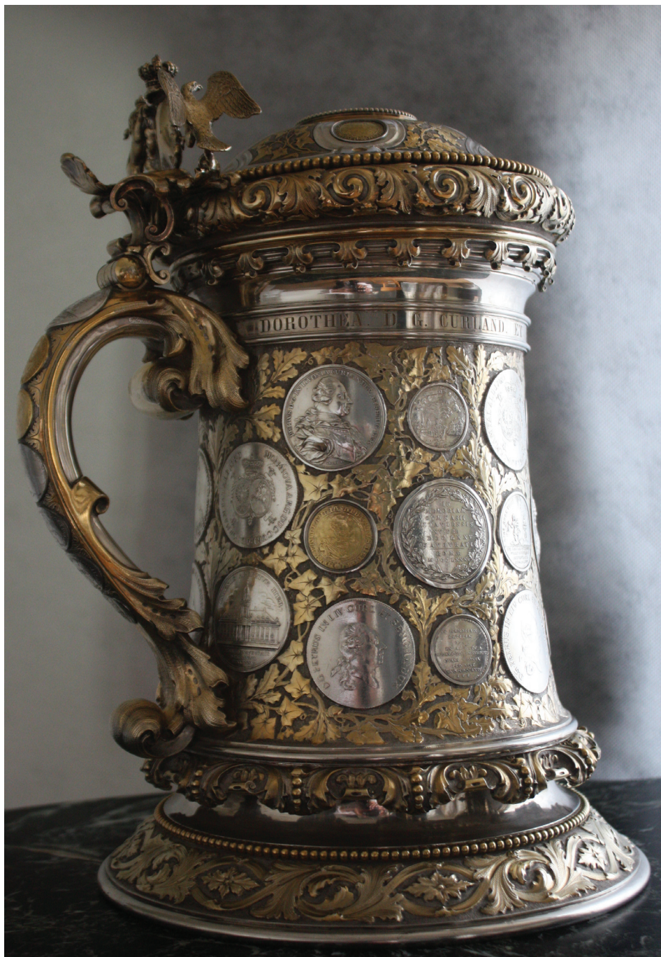
Ryc. 1. Widok ogólny kufła.