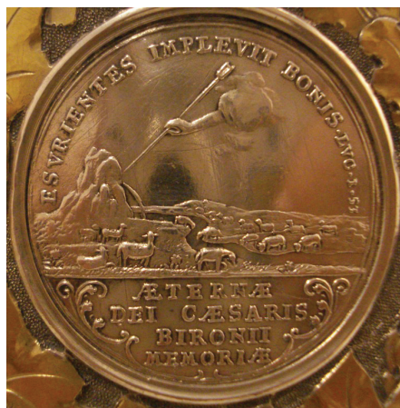
Ryc. 4–5. Ernest Jan Biron, wolny pan Sycowa, medal „Na inaugurację kaplicy protestanckiej na zamku w Sycowie”, 1736 (Av. nr 9, Rv. nr 37)

PS.118.24 ( Ten jest dzień, który uczynił Pan [radujmy się i weselmy się węż] ) 14 . W odcinku: OB SACRA EVANGELI/ WARTENBERGÆ/ INSTAVRATA/1736.D.4.NOV. („Na przywrócenie Świętej Ewangelii w Sycowie, 1736, dnia 4 listopada”).