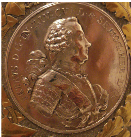
Ryc. 23. Piotr Biron, medal portretowy niedatowany, jednostronny, 1766–1767 (nr 28)

wolna, bez inskrypcji, bez wizerunku”. Najprawdopodobniej w kufel wprawiono analogiczny okaz, a sygnatura brzmiała GRAEFENSTEINN.