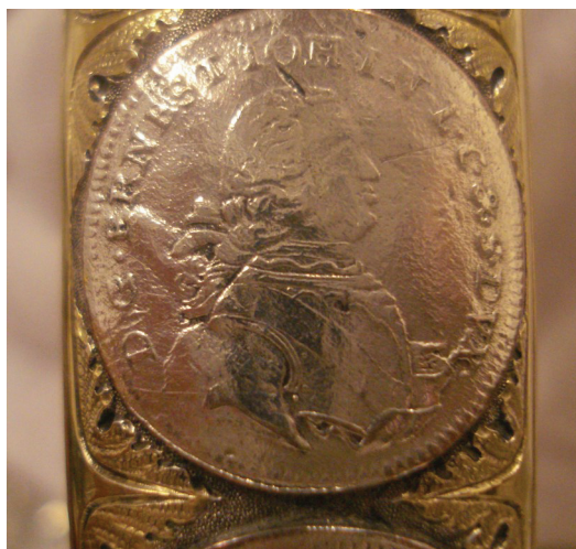
Ryc. 14. Kurlandia, Ernest Jan Biron, trojak 1765, Av. (nr 13)

Kopicki 2006, nr 99a; Mrowiński 1989, nr 85. W naczyniu nr 15.