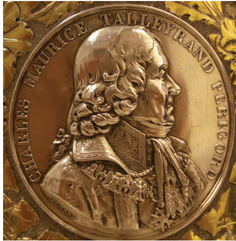
Ryc. 34. Maurycy de Talleyrand, medal kommemoratywny, 1838 (nr 32)