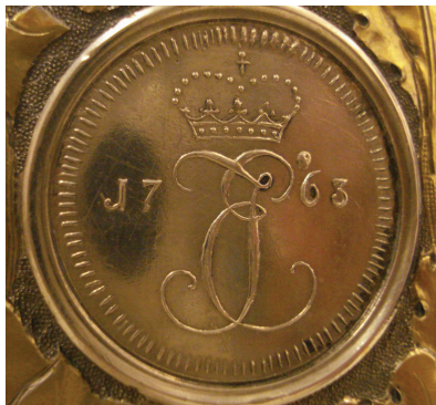
Ryc. 8. Kurlandia, Ernest Jan Biron, szóstak próbny 1763, jednostronny (nr 41)

Ernest Jan Biron po ponownym objęciu tronu Kurlandii i Semigalii wybijał w mennicy w Mitawie obiegowe monety kurlandzkie w latach 1763–1765 16 . Za panowania Augusta III, w 1763 r., opuściły mennicę grosze srebrne i szóstaki. Dwa typy szóstaka z 1763 r., z widocznymi awersami, umieszczone są w korpusie kufła pod nr 41 i 43.