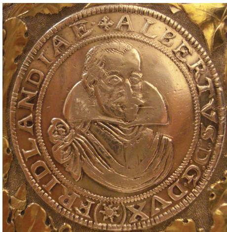
Ryc. 27. Księstwo Frýdlanckie, Albrecht Wallenstein (1624–1634), talar 1626 (nr 44)

W naczyniu umieszczone są cztery monety Wallensteina z widocznymi awersami: w korpusie talar wybity w 1626 r. (nr 44) i dukat podwójny z 1627 r. (nr 19) oraz po dukacie z 1629 r. w dwóch odmianach awersu, w pokrywie (nr 3) i uchwycie (nr 10). Wszystkie zostały wybite w Jičínie 38 .