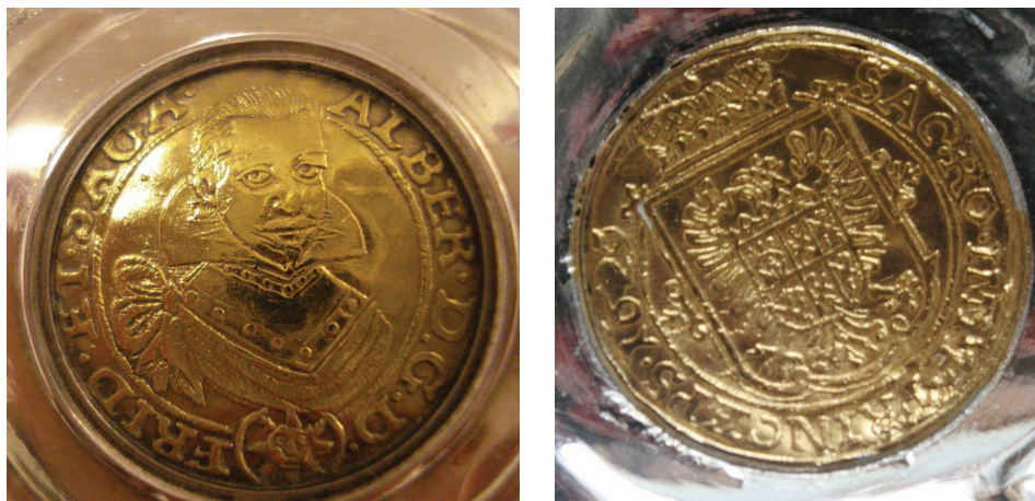
Ryc. 29. Księstwo Frýdlanckie, Albrecht Wallenstein, dukat 1629 (nr 3, Av. i Rv.)

Księstwo Frýdlanckie, Albrecht Wallenstein, dukat 1629, mincmistrz G. Reick, men. Ji- čín. Złoto, śr. 21 mm (ryc. 29).