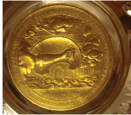
Ryc. 36. Fryderyk Wilhelm III (1797–1840), medal nagrodowy „Za ratunek z narażeniem życia”, niedatowany (1806) (nr 1, Av i Rv.)

Prusy, Fryderyk Wilhelm III (1797–1840), medal nagrodowy „Za ratunek z narażeniem życia”, niedatowany (1806), medalier D. F. Loos (1735–1819), men. Berlin. Złoto, śr. 50 mm (ryc. 36).