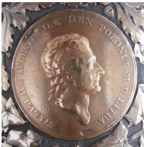
Ryc. 24. Stanisław August, medal nagrodowy „Pro fide, lege et grege”, ok. 1770 (nr 30)