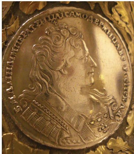
Ryc. 3. Rosja, Anna, rubel 1732, Av. (nr 45)

Książę Ernest Jan karierę polityczną i pozycję zawdzięczał Annie Iwanównie, księżnej kurlandzkiej i cesarzowej Rosji. W korpus naczynia wmontowany jest jej rubel w srebrze z 1732 r.