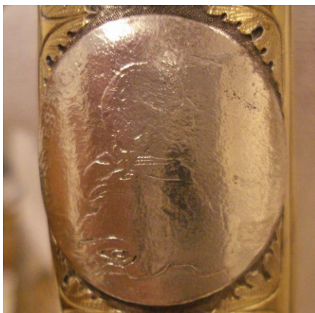
Ryc. 11. Kurlandia, Ernest Jan Biron (1737–1740, 1763–1769), szóstak 1764, Av. (nr 12)