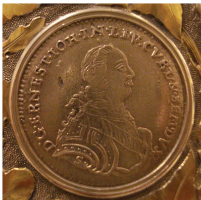
Ryc. 9. Kurlandia, Ernest Jan Biron, szóstak 1763, Av. (nr 43)