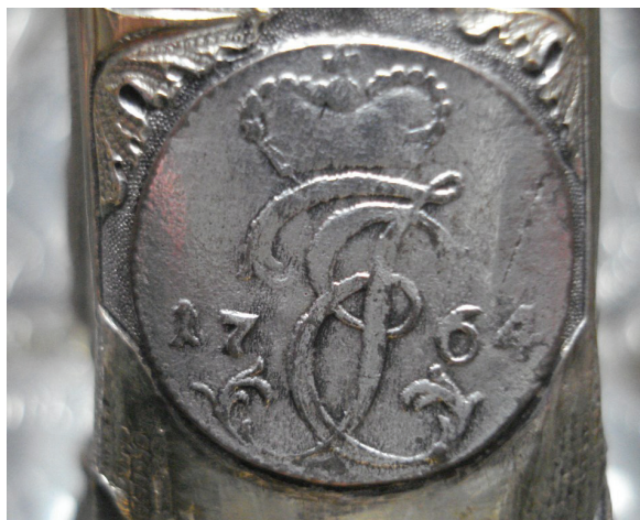
Ryc. 13. Kurlandia, Ernest Jan Biron, grosz 1764, Av. (nr 15)