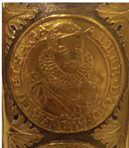
Ryc. 30. Księstwo Frýdlanckie, Albrecht Wallenstein, dukat 1629 (nr 10)

Nohejlová-Prátová 1969, taf. IV/32. W naczyniu nr 3.