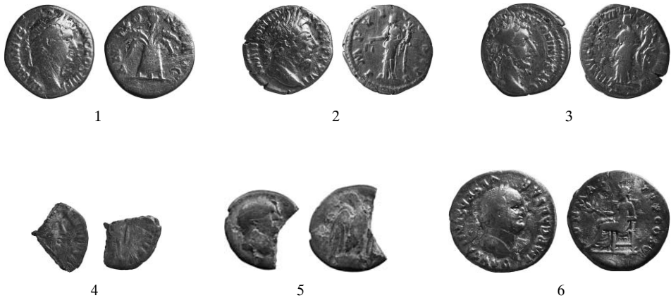
Ryc. 3. Kolejne denary z rejonu ujścia Okrzejki. Numery jak w tekście. Skala 1:1