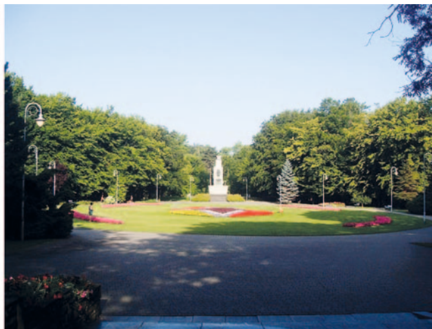
Il. 2. Współczesny stan terenów po przedwojennych miniaturowych ogrodach zoologicznych: a) Park Miejski im. F. Kachla w Bytomiu (fot. A. Steuer-Jurek 2015), b) Park Miejski im. T. Kościuszki w Katowicach (fot. A. Steuer-Jurek, 2015)