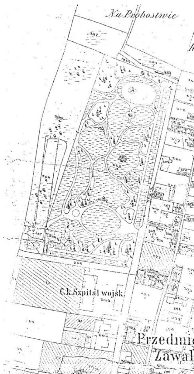
Il. 2. Ogród Strzelecki w Tarnowie — plan katastralny z 1927 roku. Sad usytuowany w północno-zachodniej części parku odseparowany od jego części wypoczynkowej.

W podobny sposób zaprojektowano układ przestrzenny Ogrodu Strzeleckiego w Tarnowie, otwartego dla publiczności w 1869 roku (Potępa, 1979).