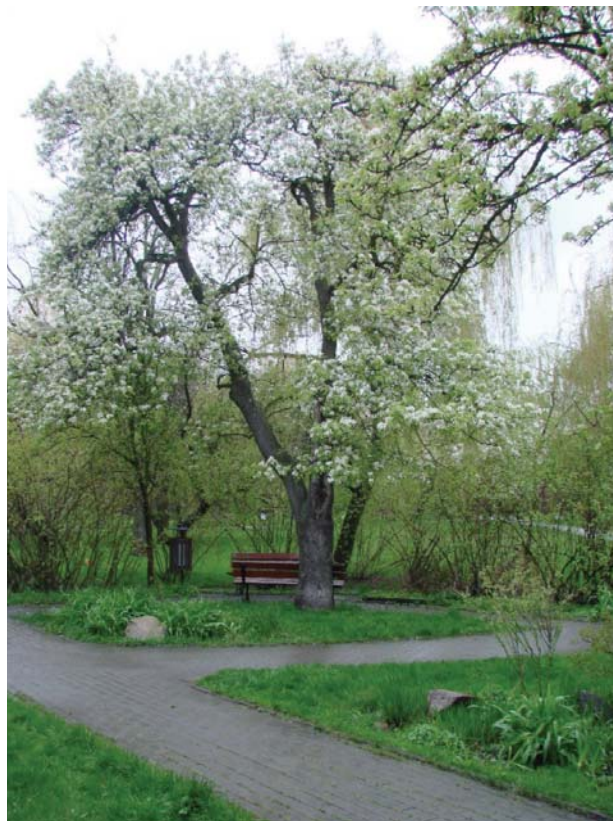
II. 4. Miejsce z ławką przeznaczone do kameralnego odpoczynku, usytuowane pod starą jabłonią. Park Sady Żoliborskie, Warszawa (fot. K. Kimic, 2017).

III. 3. Old fruit trees — a remnant of former allotment gardens. The Pole Mokotowskie Park, Warsaw (photo: K. Kimic, 2017).