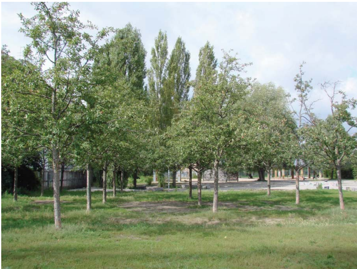
II. 6. Regularne nasadzenia drzew owocowych w nowo utworzonym sadzie. Mauerpark, Berlin (fot. K. Kimic, 2017).