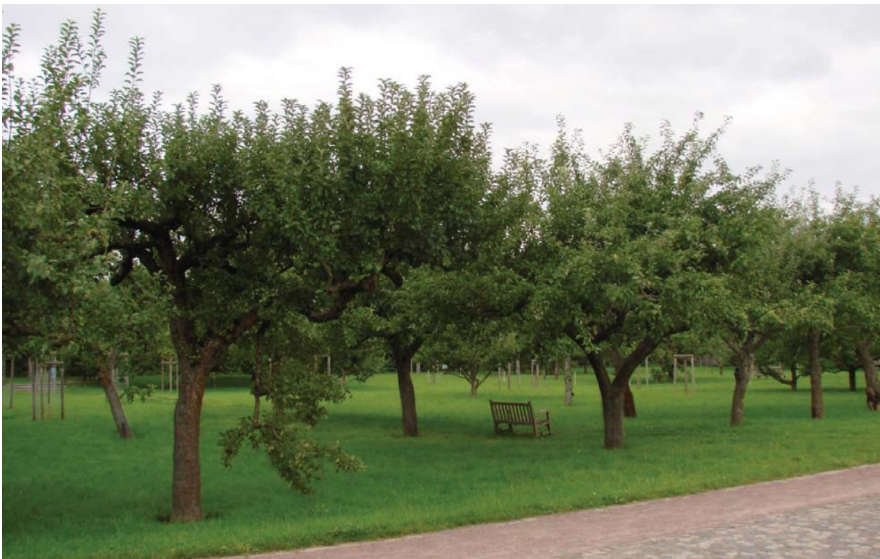
Il. 5. Ławeczki ustawione pod drzewami owocowymi w sadzie. Britzer Garten, Berlin.