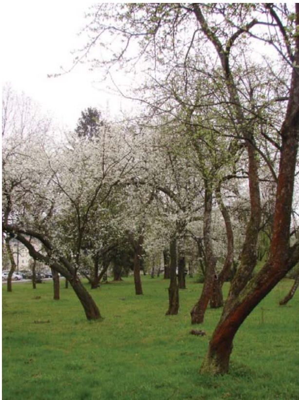
II. 3. Stare drzewa owocowe — pozostałość po ogrodach działkowych. Park Pole Mokotowskie, Warszawa.

III. 3. Old fruit trees — a remnant of former allotment gardens. The Pole Mokotowskie Park, Warsaw.