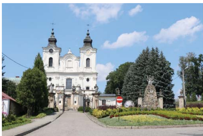
Il. 8. Zespół kościelno-klasztorny oo. Bernardynów w Dukli obecnie. Widok od strony południowej.