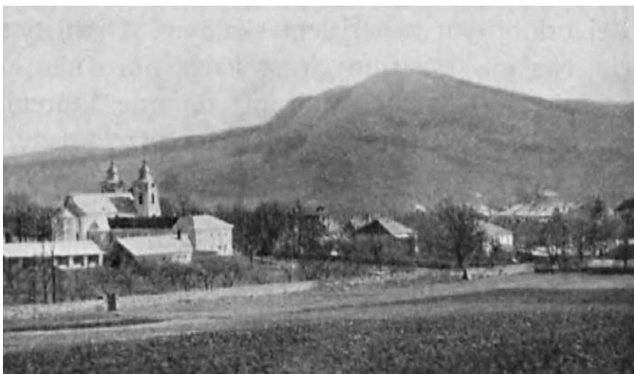
Il. 7. Widok na kościół i klasztor oo. Bernardynów od strony północno-zachodniej w latach trzydziestych XX wieku.