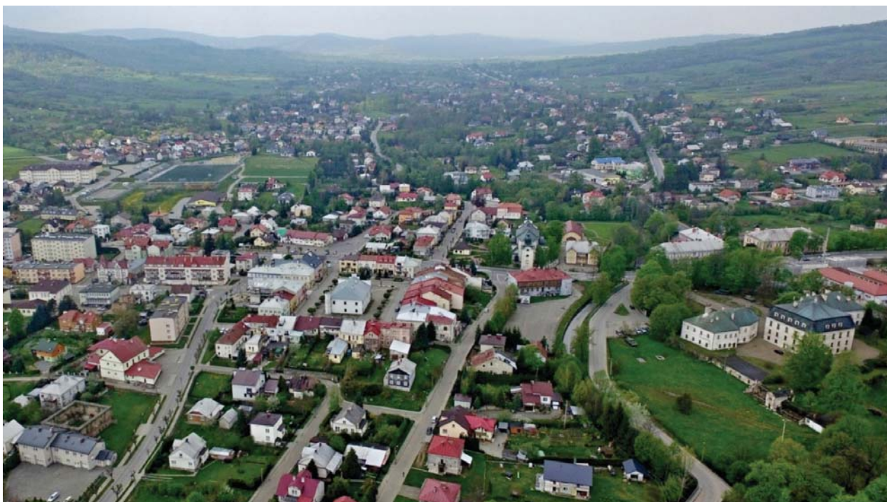
Il. 2. Widok z lotu ptaka na Duklę.