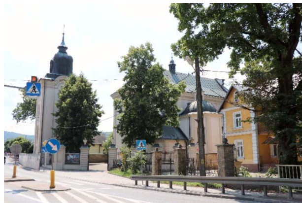
Il. 6. Kościół parafialny pw. św. Marii Magdaleny w Dukli obecnie. Widok od strony północno-wschodniej.

Ill. 5. Parish church of St. Mary Magdalene in Dukla nowadays. View from the south-east.