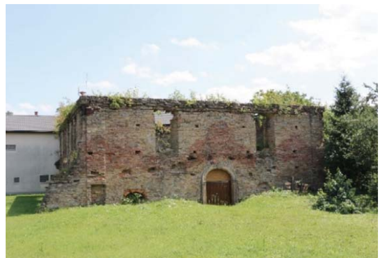
Il. 12. Ruiny synagogi w Dukli obecnie. Widok od strony południowej.

III. 11. Ruins of the synagogue in Dukla nowadays. View from the south-west.