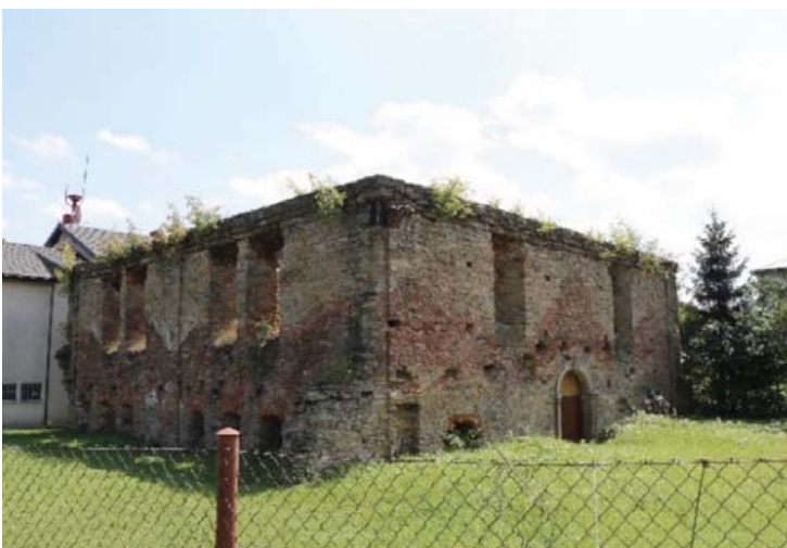
Il. 11. Ruiny synagogi w Dukli obecnie. Widok od strony południowo-zachodniej (fot. D. Kuśnierz-Krupa, 2018).

Obecny obiekt, a właściwie jego ruiny, pozbawione dachu, pochodzą z drugiej połowy XVIII wieku i znajdują się przy ulicy Cergowskiej. Zbudowano go z kamienia polnego i cegły, na planie kwadratu. Synagoga jest piętrowa, wejście od zachodu zwieńczone jest archiwoltą z kluczem. Na południowej ścianie znajdują się hebrajskie inskrypcje. W trakcie II wojny światowej synagoga została zdewastowana przez hitlerowców. Do naszych czasów przetrwały