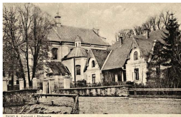
Il. 4. Kościół parafialny pw. św. Marii Magdaleny oraz plebania w pierwszej połowie XX wieku na archiwalnej pocztówce.

te, rokokowe wyposażenie wnętrza. Na jej sklepieniu znajduje się polichromia przedstawiająca sceny z życia i śmierci św. Marii Magdaleny. Wiadomo, że twórcami wyposażenia kościoła byli rzeźbiarze lwowscy (Łopatkiewicz i Łopatkiewicz, 2005, s. 25). Ołtarz zdobią między innymi rzeźby prezentujące Chrystusa oraz Marię Magdalenę. Znajdują się tutaj również rzeźby alegoryczne, które przedstawiają cztery postacie symbolizujące: wiarę, nadzieję, miłość i pokutę, a także bogato zdobione tabernakulum. W kaplicach bocznych, na ścianach, znajdują