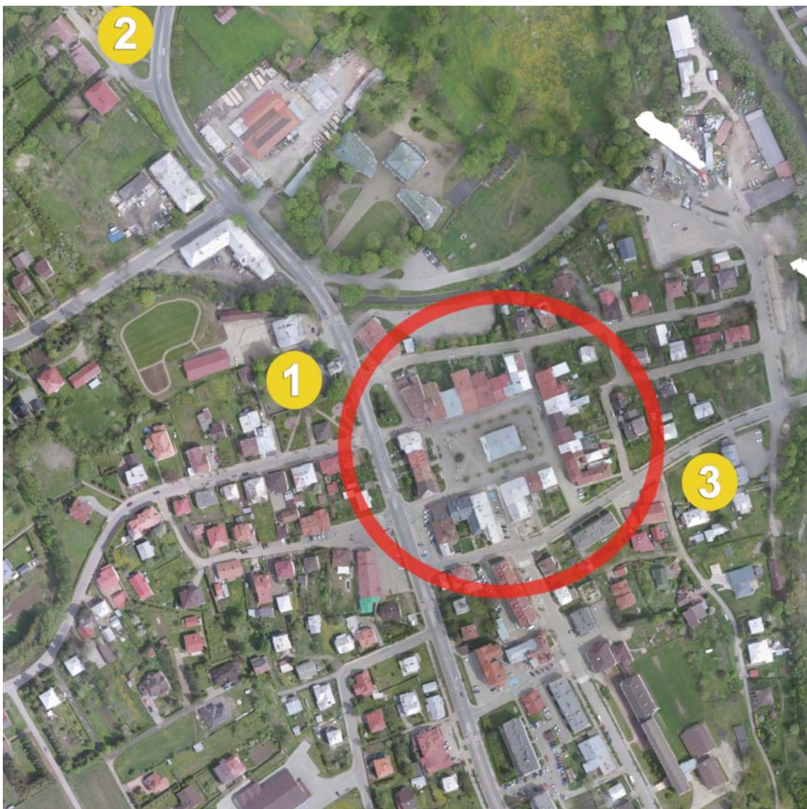
Il. 1. Zabytki sakralne miasta zaznaczone na zdjęciu lotniczym Dukli (fot. W. Gorgolewski, 2019).

Zasadniczo, wymieniona wyżej barokowa świątynia przetrwała do naszych czasów. Ma ona boga-