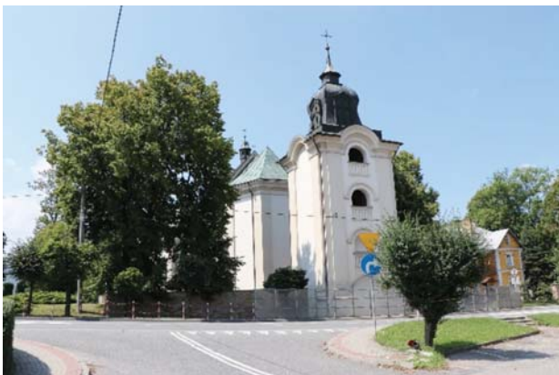
Il. 5. Kościół parafialny pw. św. Marii Magdaleny w Dukli obecnie. Widok od strony południowo-wschodniej (fot. D. Kuśnierz-Krupa, 2018).

Ill. 5. Parish church of St. Mary Magdalene in Dukla nowadays. View from the south-east (photo: D. Kuśnierz-Krupa, 2018).