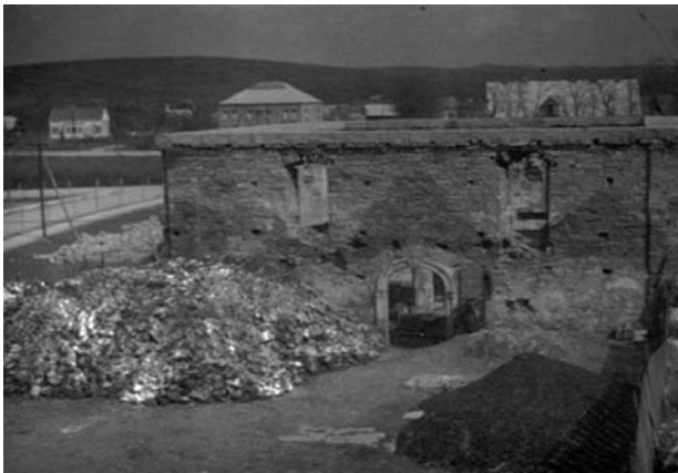
Il. 10. Synagoga w Dukli, ruiny po II wojnie światowej (fot. [w:] Archiwum Katedry HAUiSzP WA PK).

Ostatnim z analizowanych obiektów sakralnych miasta jest synagoga, przypominająca o żydowskim dziedzictwie kulturowym Podkarpacia. Pierwsi Żydzi zamieszkali w Dukli na przełomie XVI i XVII wieku. Ich głównym zajęciem stał się handel węgierskim