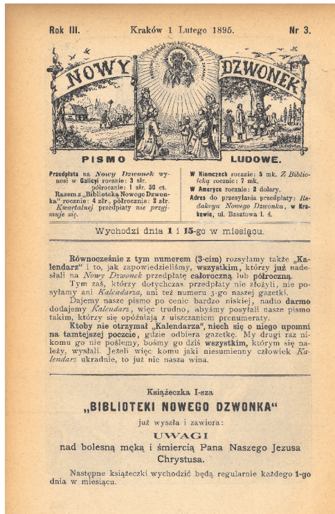
Rycina 3. Winieta „Nowego Dzwonka”

politycznie wieś, trudno było od tej problematyki uciec. Można też stwierdzić, że „Nowy Dzwonek” traktował swoich czytelników poważniej niż np. wspomniany „Krakus”, który posługiwał się zamiast argumentami — inwektywami i przezwiskami wobec politycznych przeciwników. „Nowy Dzwonek”, również z założenia pismo konserwatywne, starał się natomiast wyjaśniać czytelnikom swoje stanowisko wobec bieżących zagadnień politycznych. Oprócz tego znalazły się w nim wszystkie rodzaje materiałów, których oczekiwali czytelnicy czasopism ludowych: od artykułów na tematy religijne, poprzez powiastki, do ciekawostek z kraju i ze świata 69 .