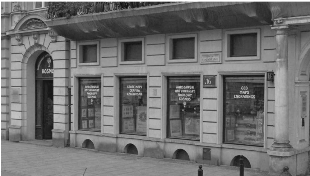
Rycina 1. Warszawski Antykwiariat Naukowy Kosmos wspólnie

z czego ponad 80 procent stanowiły czasopisma 13 . Asortyment w katalogach aukcyjnych porządkuje się w rozmaity sposób, a kryteria podziału przecinają się nawzajem, głównie formalne i tematyczne. W analizowanej ofercie czasopisma znalazły się kilku działach, znakomitą większość — 906 pomieszczono w jednym, ogólnym dziale. Oprócz prasy polskiej znalazło się tam również kilkanaście obcych tytułów oraz niewielka liczba innego rodzaju wydawnictw, które nie można sklasyfikować jako periodyczne, aczkolwiek pewne związki z takowymi mają 14 . W zestawie znalazły się tytuły od XVIII wieku po rok 1945, które przedstawiono w niniejszym opracowaniu według przyjętej periodyzacji dziejów prasy, przy czym tytuły wychodzące poza dany okres odnotowano dwukrotnie, tylko jeśli oferowano egzemplarze tak datowane. Pogrubione zostały tytuły, które nabyła do swoich zbiorów Biblioteka Narodowa, podkreślono zaś kupione przez Bibliotekę Jagiellońską; w niektórych przypadkach obie ksiąźnice wybierały poszczególne numery tych samych czasopism.