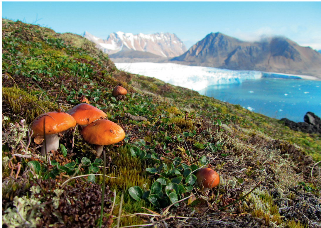
Tundrę tworzą krzewinki, mchy, porosty, a także grzyby

łobiegunowy przelatuje w tym rejonie prawie 15 razy na dobę, to jest co robić. Jest także fizyk atmosfery. Bada wszelkiego rodzaju aerozole, promieniowanie UV, ilość ozonu. Mechanik wyprawy i tzw. złota rączka, bo przy tak dużej ilości sprzętu mechanik nie jest w stanie wszystkiego ogarnąć. No i w końcu jest kierownik wyprawy, też się go nie zastąpi automatyczną sekretarką.