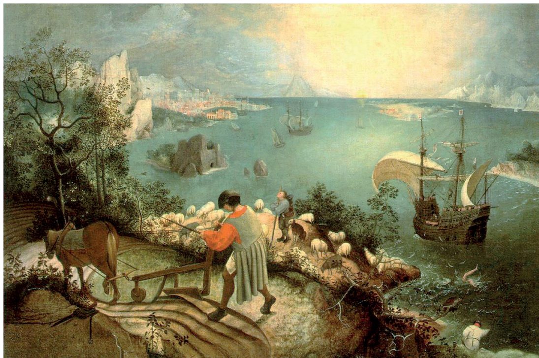
Pieter Bruegel (starszy), Pejzaż z upadkiem Ikara, 1557