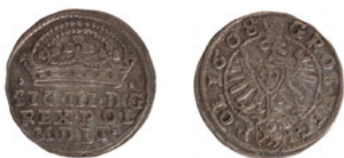
Ryc. 3. Zygmunt III Waza (1587–1632), grosz koronny, 1608, men. Kraków, srebro, w. 1,80 g, śr. 20,5 mm, N/1142/ML

Pozostałe dwa fałszywe grosze z datą 1608 imitują typ z koroną na awersie (Ryc. 3) 9 .