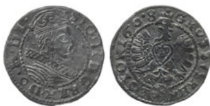
Ryc. 13. Falszywy grosz Zygmunta III ze zbiorów Muzeum Narodowego w Warszawie (nr inw. NPO 70426)

Grupa C jest najliczniejsza [nr 10–17; ryc. 14–21]. Wizerunek władcy okala perełkowa obwódka, a zbroję zdobi mniej detali aniżeli na monetach grupy poprzedniej. W dookolnej legendzie: SIGISM III D G RLX OEL M D L słowo REX zniekształcono do formy RLX, a skrót POL zastępują litery OEL. Tak jak w grupie A, Orła w całości otacza obwódka, tutaj jednak perełkowa. Także pomieszczona na jego piersiach smukła tarcza z herbem Wazów ma inną formę aniżeli na groszach grupy A i B; tutaj przypomina tarczę hiszpańską. Legendę: G:ROSSVS REGN – POLON . 1608: dzieli u dołu owalna tarcza z herbem Lewart.