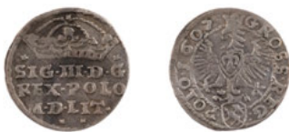
Ryc. 2. Zygmunt III Waza (1587–1632), grosz koronny, 1607, men. Kraków, srebro, w. 1,484 g, śr. 19,0–19,5 mm, N/5965/ML

Pozostałe dwa fałszywe grosze z datą 1608 imitują typ z koroną na awersie (Ryc. 3) 9 .