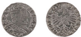
Ryc. 1. Zygmunt III Waza (1587–1632), grosz koronny, 1607, men. Kraków, srebro, w. 1,586 g, śr. 19,1–19,4 mm, N/3515/ML