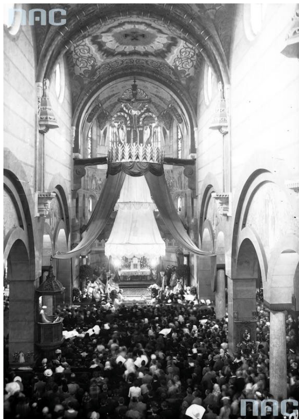
5. Dekoracja okolicznościowa w kościele Jezuitów na Wesołej w Krakowie, 12–13 czerwca 1938 r.