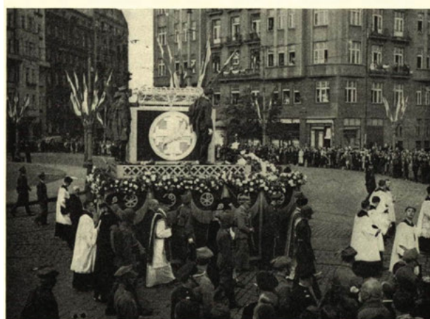
WARSZAWA. — Bydwan z relikwiami na Placu Unii Lubelskiej.

8. Prezydent Ignacy Mościcki ofiarujący jako wotum Krzyż Niepodległości podczas nabożeństwa na placu Zamkowym w Warszawie, 18 czerwca 1938, fotografia w: Święty Andrzej Bobola. Pamiętnik kanonizacji i powrotu jego ciała do ojczyzny , Chicago 1938, s. 24