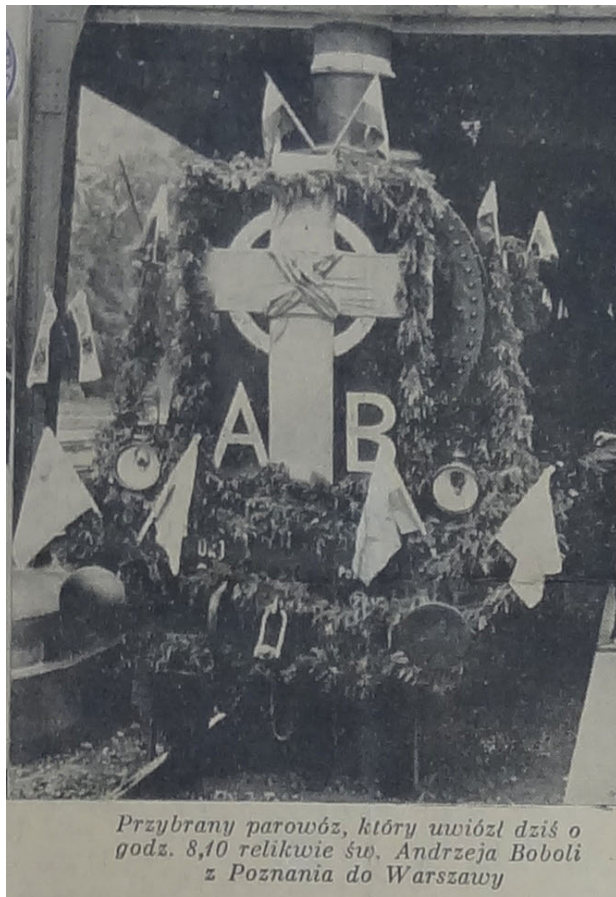
6. Pociąg specjalny na dworcu w Poznaniu, 17 czerwca 1938 r., „Kurier Poznański”, 1938, nr 272 (18 czerwca), s. 8