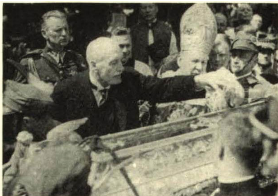
Prezydent Polski, p. Ignacy Mościcki, składa na trumnie order.

8. Prezydent Ignacy Mościcki ofiarujący jako wotum Krzyż Niepodległości podczas nabożeństwa na placu Zamkowym w Warszawie, 18 czerwca 1938, fotografia w: Święty Andrzej Bobola. Pamiętnik kanonizacji i powrotu jego ciała do ojczyzny , Chicago 1938, s. 24