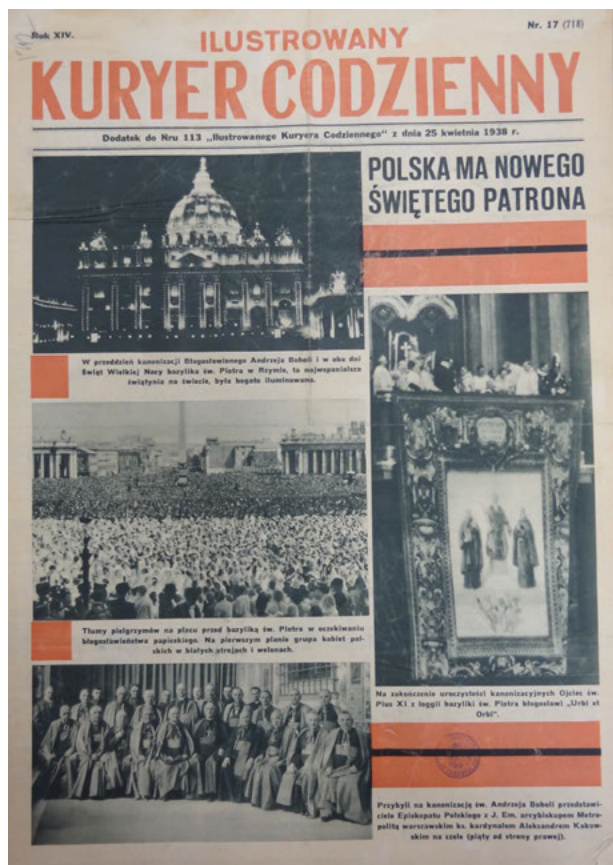
2. Dodatek do „Ilustrowanego Kuriera Codziennego”, 1938, nr 113 (25 kwietnia) poświęcony kanonizacji bł. Andrzeja Boboli

szurkę Złoty list z nieba św. Andrzeja Boboli do Polonji w Ameryce , rekomendowaną przez biskupa sufragana Detroit Stefana Woźnickiego 20 .