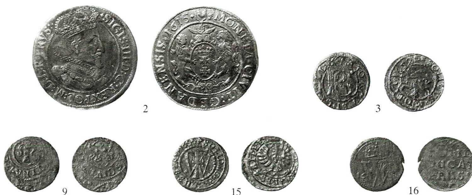
Ryc. 2. Malbork. Domniemany zespół. Skala 1:1