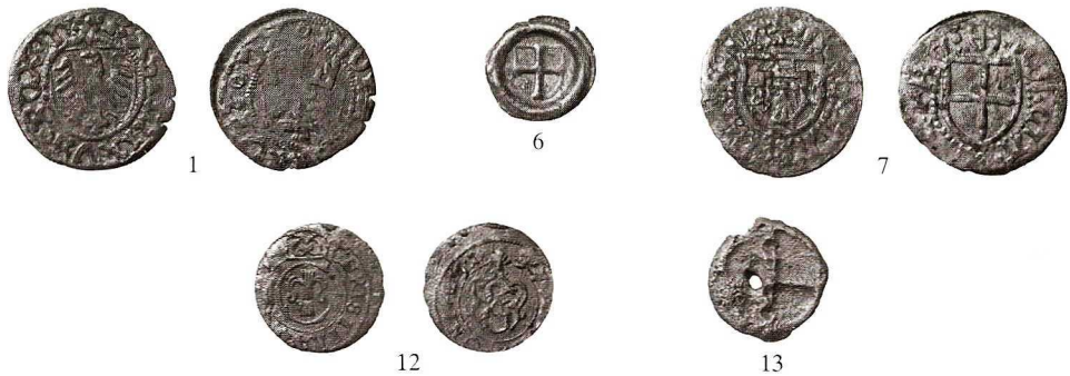
Ryc. 3. Malbork. Sezon 2006, wykop IV. Skala 1:1

Monety PRL (3 szt.), 1 zł (1989), 5 zł (1977 i 1987). Nr inw. MzM/1/II/01. PRL 5 zł. (1989), współczesny wkop pod studzienką. Nr inw. MzM/1/II/07.