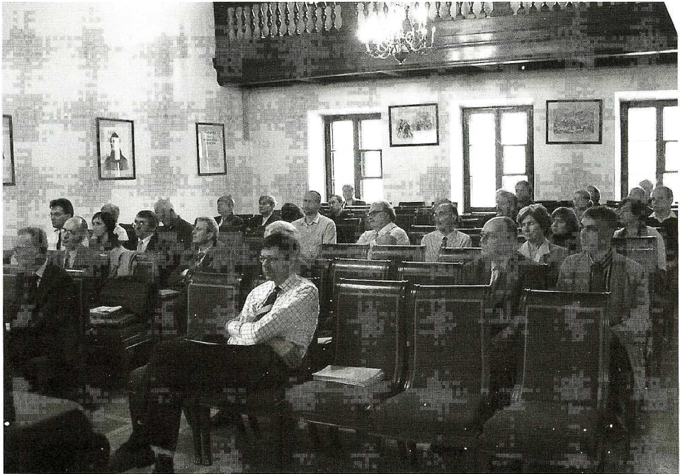
Ryc. 1. Uczestnicy sympozjum z okazji 50-lecia Wiadomości Numizmatycznych .