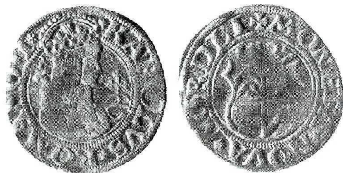
Ryc. 6. Mściwojów. Pół batzena Eberharda IV. Skala 1,5:1

M.: „Mściwojów-zbiornik”, moneta nie była związana z warstwą kulturową. D.: 20 VI. 1999. Ok.: ratownicze badania archeologiczne prowadzone przez firmę „EKSPLODER”. L.: 1 moneta. Zbiór: moneta trafi do muzeum w Jaworze (Legnicy?).