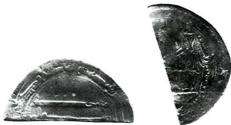
Ryc. 1. Szestno. Dirham al-Manşura. Skala 1,5:1

1. Abbāsīdzi , al-Manşur (136–158 H. = 754–775 r.), dirham, men. [Madīnat as-Salām?], 155 H. (771/2 A.D.), 1,576 g, 23 mm (równo przecięta połówka), ↑ →. Moneta lekko pognięta. Grodzisko, strop warstwy niwelacyjnej, poprzedzającej budowę drewniano-ziemnego wału.