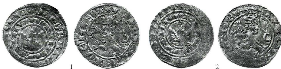
Ryc. 2. Szulec. Grosze praskie ze skarbu. Skala 1:1

1. Czechy, Jan Luksemburski (1310–1346), grosz praski, Hásková 67; waga 3,673 g, średn. 28,7 mm. Av. korona, w podwójnym otoku napis: