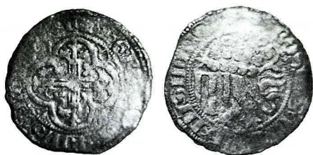
Ryc. 3. Gólaszyn. Grosz Fryderyka II. Skala 1:1. Fot. Jarosław Lewczuk

Miśnia-Saksonia , Fryderyk II (1428–64), grosz mieczowy ( Schwertgroschen ); prawdopodobnie Krug 1151–58 (Fryderyk II z małżonką Małgorzatą, men. Colditz, 1456–64 — moneta słabo czytelna i rozpoznanie niepewne). Av. krzyż liliowaty w czwórliściu, w kątach C ... V, słabo widoczna tarcza ze skrzyżowanymi mieczami, w otoku xF•DI•GR\\T\\TVRINGE•LA\\; Rv. Lew z tarczą z trzema słupami, w otoku \\ROSSVS•MARCH•MISNENS\\; 1,90 g, 27 mm.