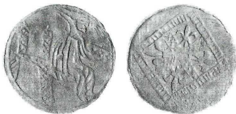
Ryc. 8. Wrocław-Rynek. Liczman. Skala 1,5:1

14 marca 1997 r. w wykopie XXIV, odc. C, jednostka stratygraficzna 9, odkryto liczman francuski (?), XV w.(?)