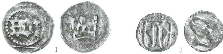
Ryc. 7. Zamek Wleń. Halerze miasta Zgorzelec i księstwa glogowskiego. Skala 1,5:1

W trakcie badań prowadzonych w 1991 r. na zamku we Wleniu odkryto 4 monety. W zasypisku pieca na wieży oraz w wykopie VI, warstwa A 8, wystąpiły 2 halerze zgorzelec- kie z XV w., natomiast w przyporze muru obwodowego zamku natrafiono na grosz praski Karola I (1346–1378). Ponadto na zamku odkryto też halerz księstwa glogow- skiego z XV w.