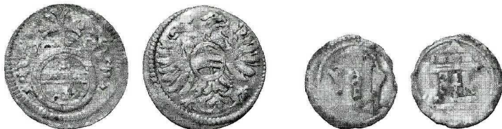
Ryc. 5. Nowe Miasteczko. Greszel Leopolda I i halerz miasta Koźuchów. Skala 1,5:1.

M.: stan. 4, północna część wschodniej pierzei rynku, teren dwóch średniowiecznych działek, wykop I. D.: 13 IX–13 X 2000 r. Ok.: ratownicze badania archeologiczne w związku z budową Banku Spółdzielczego; prowadzili mgr Małgorzata Lewczuk i dr Jarosław Lewczuk. L.: 2 monety luzem. Zbiór: Muzeum Archeologiczne Środkowego Nadodrza, Świdnica pod Zieloną Górą.