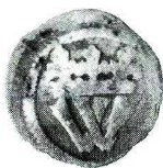
Ryc. 4. Wodzisław Śląski. Halerz wrocławski. Skala 1,5:1