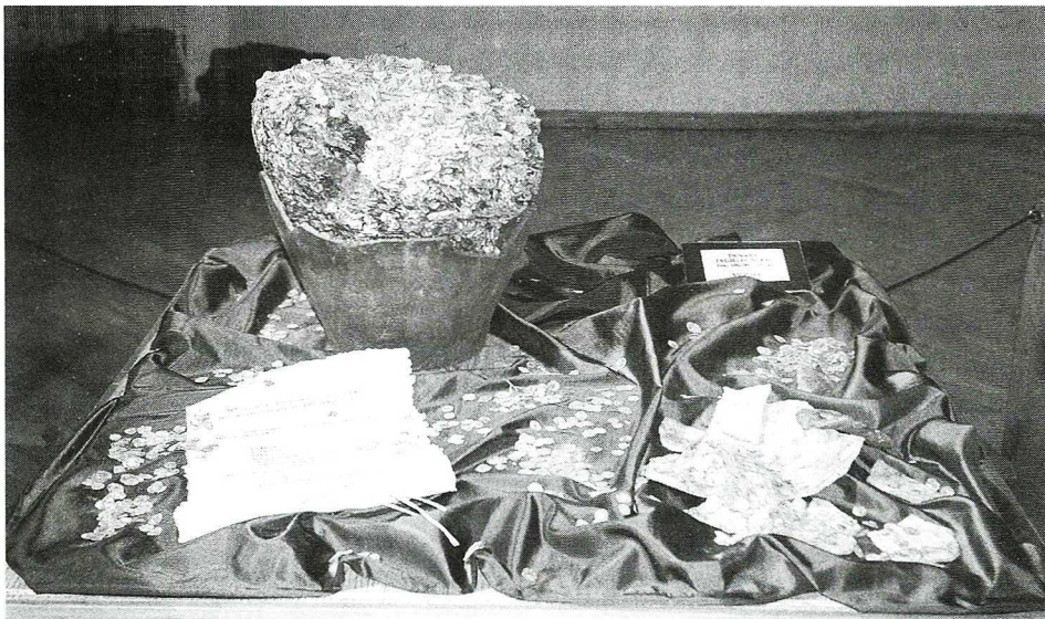
Ryc. 12. Wrocław, ul. Kazimierza Wielkiego. Skarb denarów jagiellońskich

Dalsze prace inwentaryzacyjno-konserwatorskie skarbu będą przeprowadzone przez zespół interdyscyplinarny złożony z pracowników Gabinetu Numizmatyczno-Sfragistycznego Ossolineum oraz archeologów i historyków z Uniwersytetu Wrocławskiego.