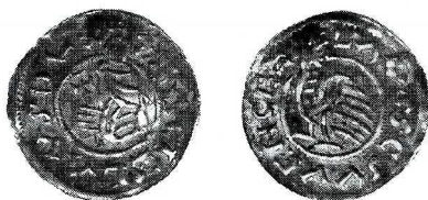
Skala 1,5:1

Av. Postać stojąca wprost, trzymająca z lewej krzyż o długim pionowym ramieniu, zbliżony do maltańskiego; na lewym ramieniu szata spięta okrągłą zaponą, obwódka wewnętrzna i zewnętrzna ząbkowana, wewnętrzna przzerwana u góry głową postaci. W otoku napis: +BRACIZLAVS (prawie leżące) DVX