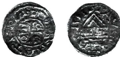
Skala 1,5:1

Av. Krzyż prosty z rozszerzonymi końcami ramion, między ramionami: N/K/V/O/, obwódka wewnętrzna liniowa, zewnętrzna perełkowa, w otoku: EBERHATEP•S