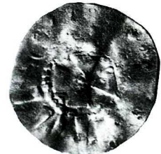
Wybrane monety ze skarbu z Naruszewa pow. Płońsk. Skala 1,5:1