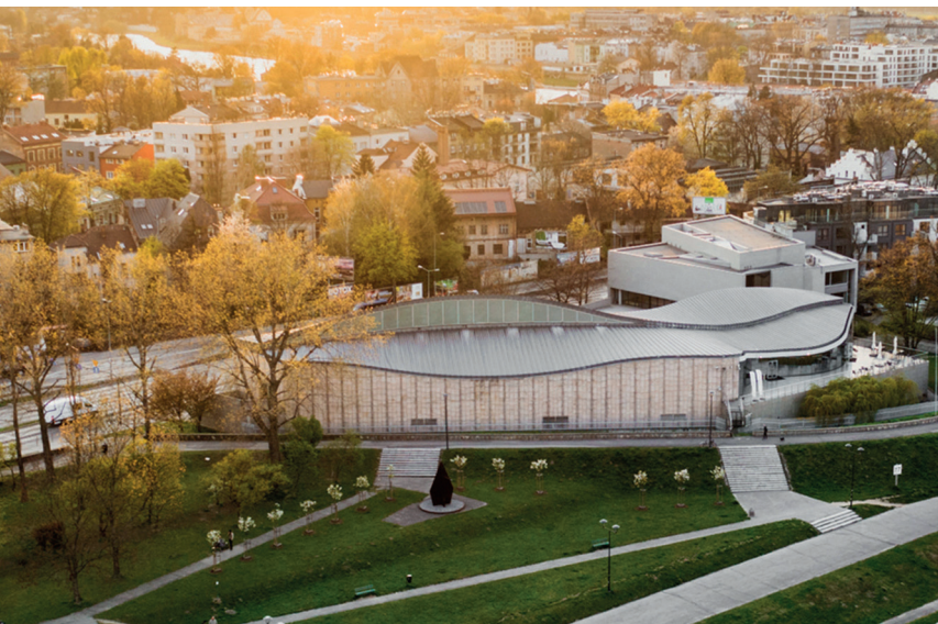
GRZEGORZ MARTY MUZEUM SZTUKI I TECHNIKI JAPONSKIEJ „MANGGHA”

Muzeum Sztuki i Techniki Japońskiej „Manggha”