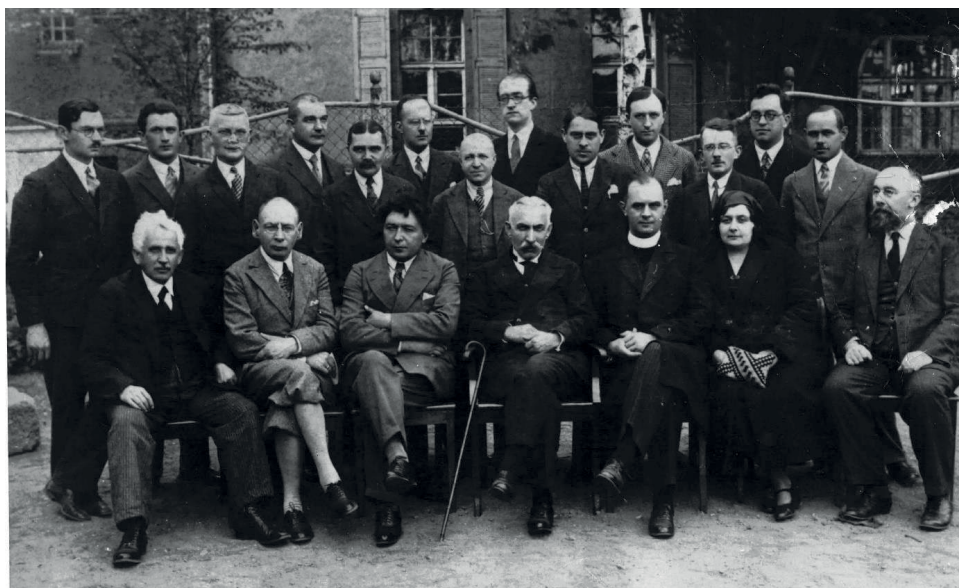
Grono profesorów Państwowego Gimnazjum Humanistycznego w Bydgoszczy w r. 1932.