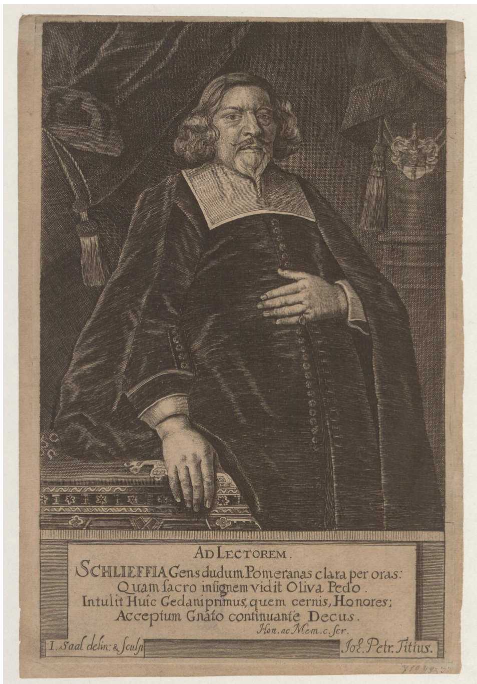
7. Isaak Saal, Portret Daniela Schlieffa, XVII wiek (PAN Biblioteka Gdańska, nr inw. 5369)