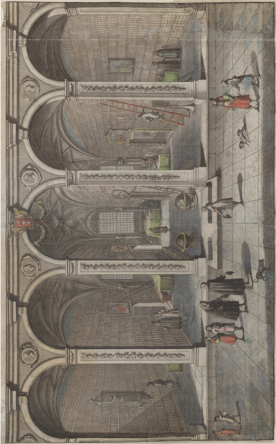
2. Widok wnętrza Biblioteki Rady Miasta Gdańska R. Curicke, Der Stadt Dantzig historische Beschreibung , Amsterdam-Dantzig 1687 (PAN Biblioteka Gdańska, sygn. Od 4503a.2 o )