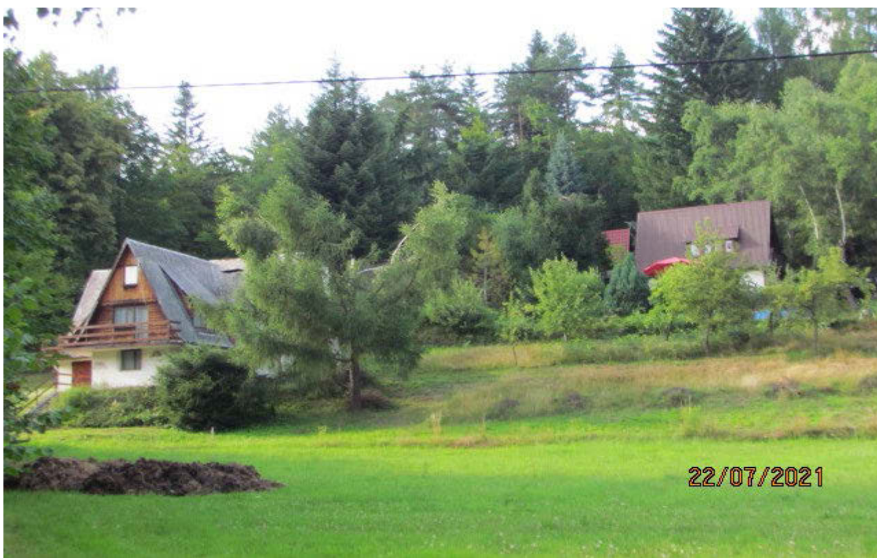
II. 1b. Fragment tego samego krajobrazu w roku 2021. Zieleń stopniowo „łagodzi” negatywne oddziaływanie wizualne zabudowy, (fot. K. Bieda).

III. 1a. Scattered buildings — post-agricultural area (Myślenice County) in the 1970s. (photo: K. Bieda).