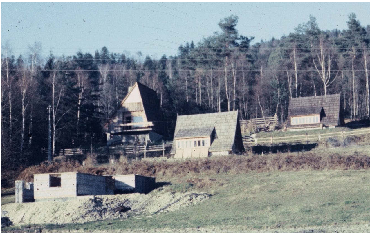
II. 1a. Rozproszona zabudowa na obszarach porolniczych (powiat myślenicki) — lata 70. ubiegłego wieku, (fot. K. Bieda).

III. 1a. Scattered buildings — post-agricultural area (Myślenice County) in the 1970s. (photo: K. Bieda).