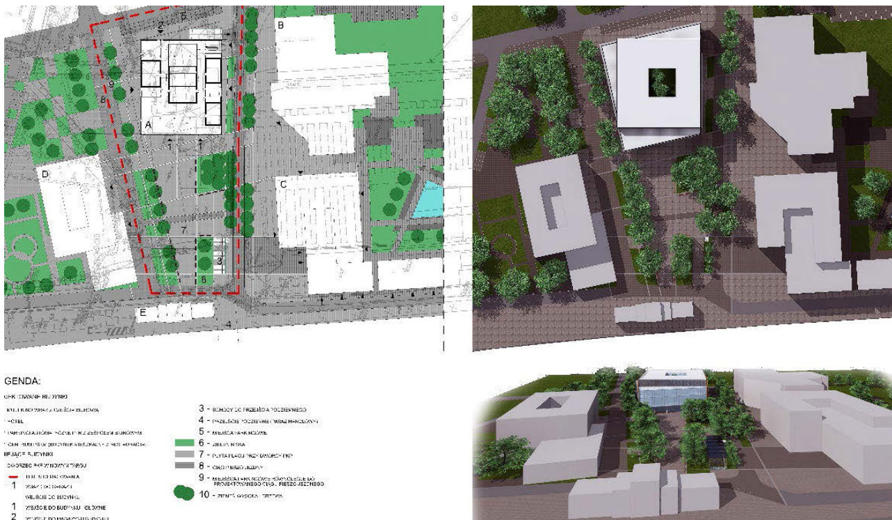
II. 3. Koncepcja zespołu zabudowy o różnych funkcjach wokół stacji Podhalańskiej Kolei Aglomeracyjnej w Nowym Targu (zgodnie z zasadą Transit Oriented Development ). Autorzy: D. Wilkus i in. — projekt dyplomowy (studia II stopnia) na kierunku Architektura w Instytucie Nauk Technicznych PPWSZ (obecnie PPUZ) w Nowym Targu, 2019.