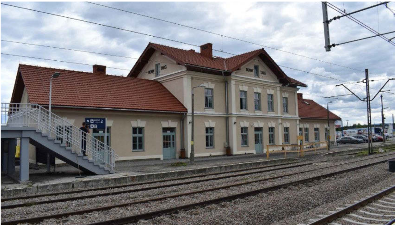
II. 2. Odnowiony dworzec kolejowy (obecnie także przystanek Podhalańskiej Kolei Aglomeracyjnej) w Nowym Targu, https://gazetakrakowska.pl/nowy-targ-zakonczy-l-sie-remont-dworca-kolejowego-nowy-dworzec-robi-wrazenie/ar/c3-15068920, (dostępne: 2.09.2021).