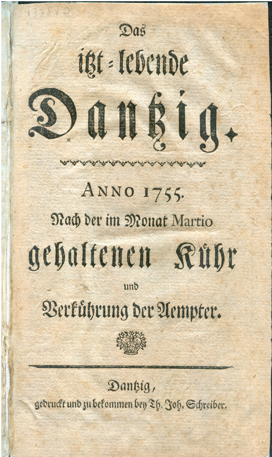
1. Das itzt-lebende Dantzig. Anno 1755... , karta tytułowa