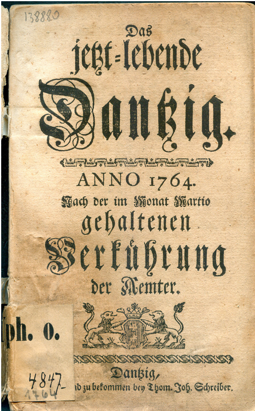
2. Das jetzt=lebende Dantzig. Anno 1764... , karta tytułowa (PAN Biblioteka Gdańska, sygn. Uph. o. 4847)