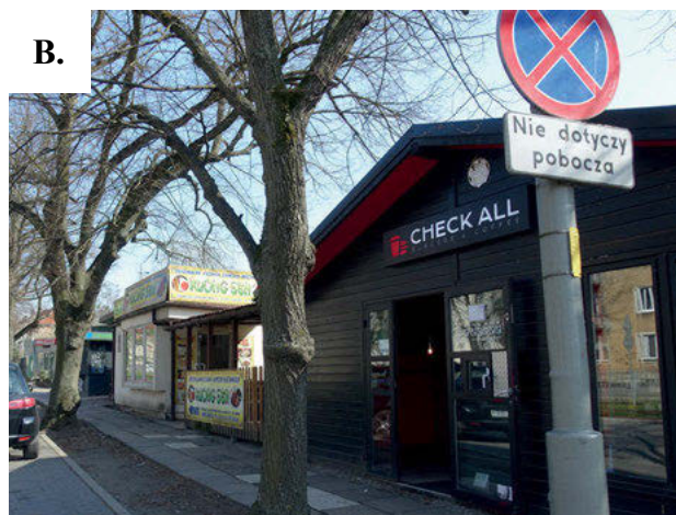
III. 3. Fragment of development covered by the local spatial plan, view from Mickiewicza Street.

II. 3. Fragment zabudowy objęty miejscowym planem, widok od ul. Mickiewicza.