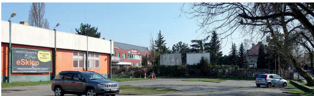
III. 5. Fragment of development covered by the local spatial development plan, view from Lelewela Street.

II. 4. Fragment zabudowy objęty miejscowym planem, widok od ul. Mickiewicza.