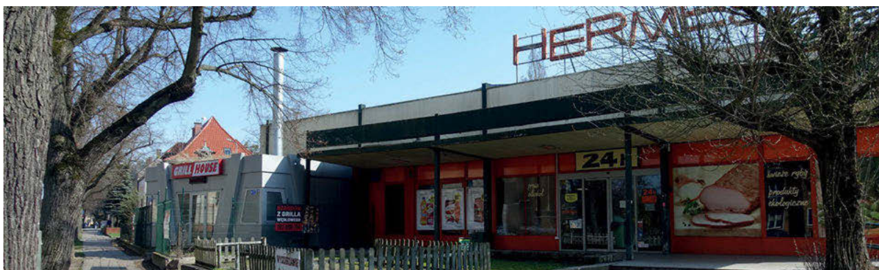
III. 4. Fragment of development covered by the local spatial development plan, view from Mickiewicza Street.

II. 3. Fragment zabudowy objęty miejscowym planem, widok od ul. Mickiewicza.