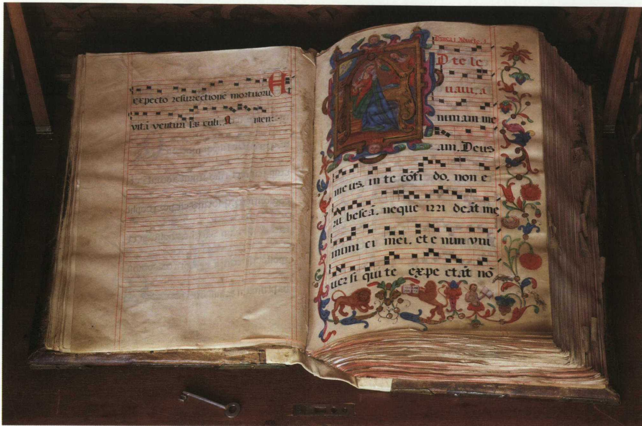
Zdzisław Nowakowski/Biblioteka Kórnicka PAN