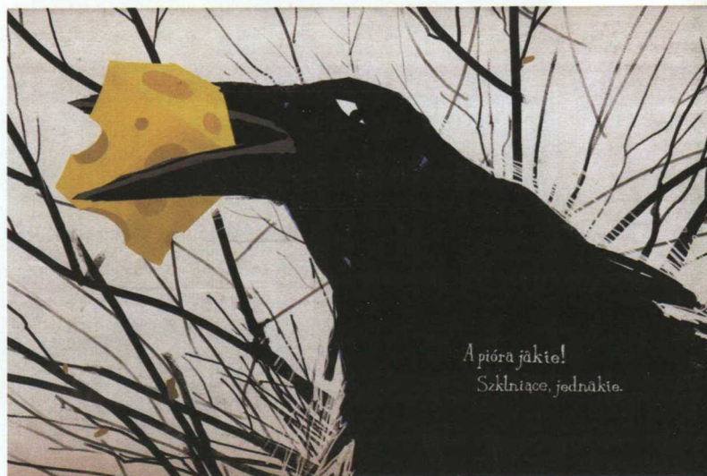
Piotr Bednarczyk, „Kruk i lis” (fragment), ilustracja wykonana w pracowni prof. Zygmunta Januszewskiego, Akademia Sztuk Pięknych, Warszawa

Przedstawiam tu projekty raczej stawiają kolejne pytania, niż dają gotowe odpowiedzi, ale to właśnie aspekt humanistyki bliski być może także badaczom zajmującym się naukami ścisłymi. Dzięki rozmowie na płaszczyźnie wspólnego nam dziedzictwa antyku spotykamy się w miejscu, skąd, zamiast oceniać, staramy się dostrzec