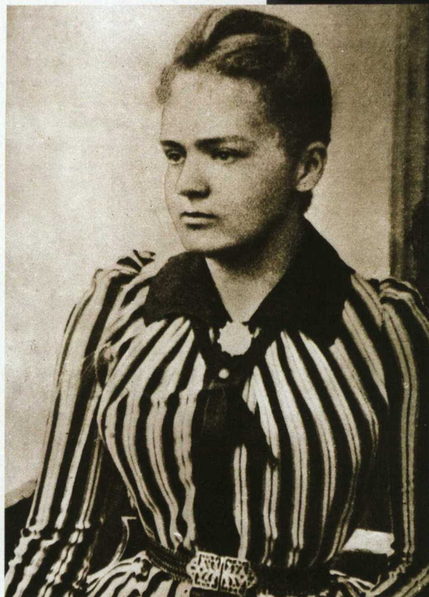
Archiwum Polskiej Akademii Nauk