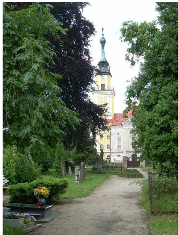
Il. 3. Cmentarz ewangelicki. Główna oś nekropolii z barokowym kościołem Zofii

Cmentarz ewangelicki założono w 2. poł. XVIII w. 20 sytuując go obok kościoła, na przedłużeniu jego poprzecznej osi, prostopadle do Kirch Allee (il. 2, 3). Wraz ze wzrostem liczby ewangelików w Pokoju, cmentarz został pod koniec XVIII w. powiększony w kierunku południowo-wschodnim. Obecnie nekropolia ma kształt zbliżony do wydłużonego prostoką-