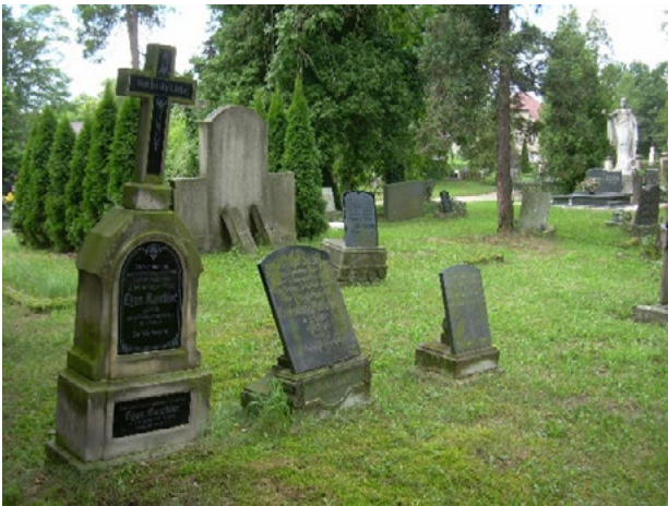
Il. 5. Cmentarz ewangelicki. Rozwiązania kompozycyjne historycznych nagrobków