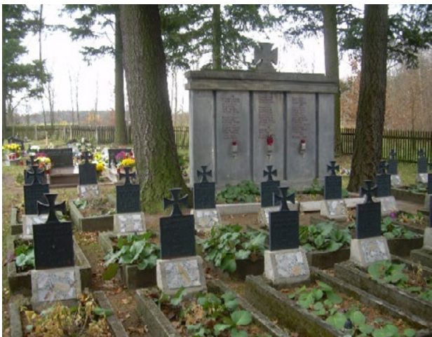
Il. 6. Cmentarz katolicki. Kwaterna żołnierzy poległych w pierwszej wojnie światowej wraz z monumentem