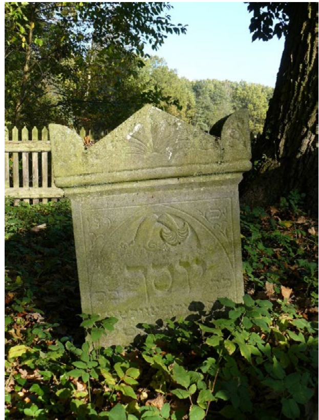
Il. 7. Cmentarz żydowski. Macewa z symbolicznym elementem reliefowym w formie złamanego drzewa (foto M.E. Adamska, 2014)

Cmentarz żydowski w Pokoju został założony ok. 1870 roku 36 . Kirkut został zlokalizowany na północno-wschodnich obrzeżach miejscowości, w pobliżu zrealizowanej wkrótce po założeniu cmentarza, a obecnie nieczynnej linii kolejowej relacji Opole-Namysłów (il. 2). Cmentarz o pow. ok. 0,14 ha, jest jednym z 18 zachowanych cmentarzy żydowskich na Śląsku Opolskim 37 . Niemal do końca lat 60. XX w. cmentarz trwał w prawie nienaruszonym stanie. W 1969 r. podjęto decyzję o likwidacji cmentarza, usunięciu nagrobków i rozebraniu domu przedpogrzebowego. Podobne działania objęły teren całego kraju zgodnie z antysemicką polityką prowadzoną przez ówczesne władze Polski. Plan likwidacji cmentarza został jednak zrealizowany w części, usunięto nagrobki z przedniej części nekropolii, pozostawiono te usytuowane w głębi. W latach 2005–2009 w oparciu o środki osób prywatnych wykonana została inwentaryzacja nagrobków, przeprowa-