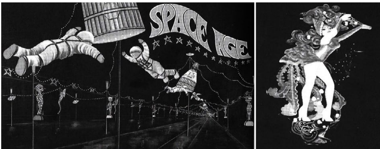
Il. 3. Instalacje świetlne w nurcie Space Age, ok. 1960 roku.