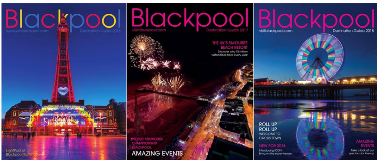
II. 4. Okładki przewodników turystycznych promujących miasto Blackpool z 2016, 2017 i 2018 roku.