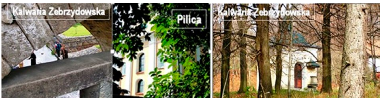
Il. 5, 6, 7. Okna (z lewej i w środku) i przeźrocze widokowe (z prawej). Wybrane przykłady uformowań sztucznych (budowlanych) i przyrodniczych (roślinność). Fot. Anna Mitkowska, 2004, 2005 (Pilica)

rozrzeźbionych lub w rozlewiskach wód integralnie zespały się z lokalnym podłożem tworząc nieskończone liczby obiektów o charakterze organicznym i malowniczym. Poczynając od XIII wieku, wraz z rozpowszechnianiem się postaw franciszkańskiego umiłowania przyrody i rozwijającą się stopniowo estetyką zmierzającą do renesansu, rezydencje, miasta i ogrody coraz częściej zaczynały otwierać się na przyrodę i doceniać jej piękno.