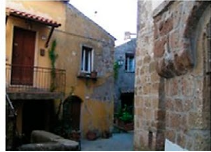
Il. 8, 9, 10. „Wnętrza” krajobrazów miasteczka Pitigliano w Toskanii. Fot. Anna Mitkowska, 2017