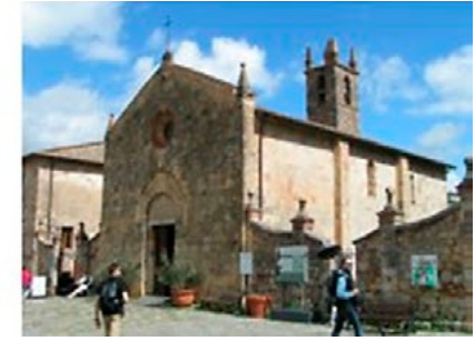
Il. 11, 12, 13. Romańskie kościoły typu pieve w Toskanii, San Leo i Monteriggioni (z prawej). Fot. Anna Mitkowska, 2017