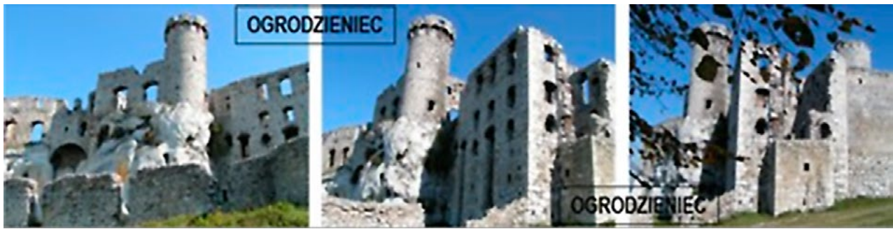
Il. 1, 2, 3. Ruiny zamku w Ogrodzieńcu, Jura Krakowsko-Częstochowska. Fot. Anna Mitkowska, 2007