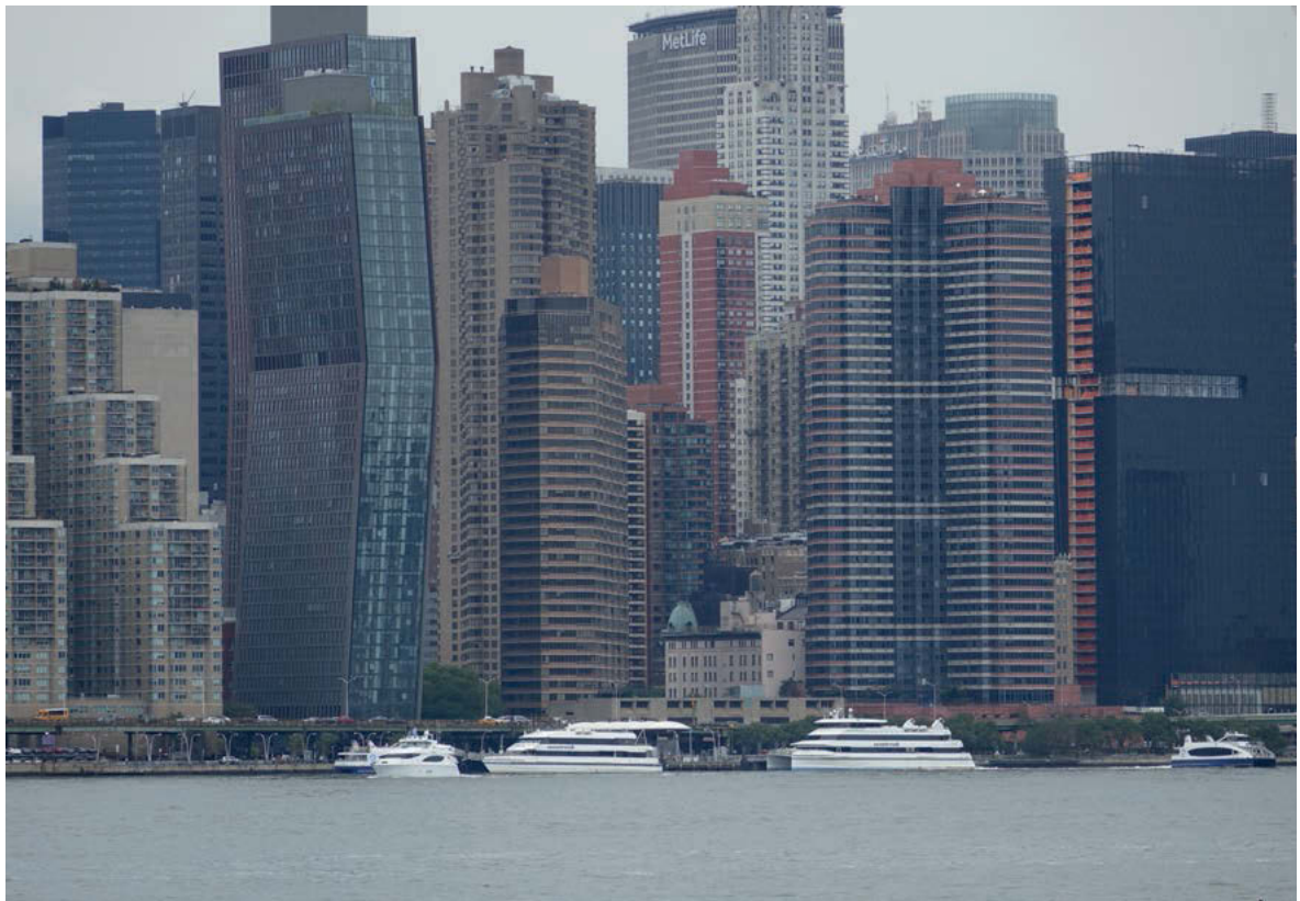
III.5. Ferry transport along East River.