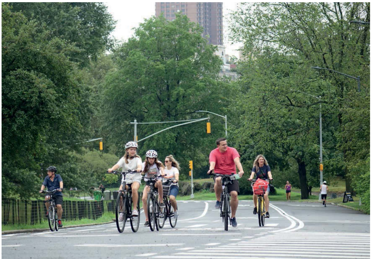
III. 6. Contemporary bicycle paths in the historical space of Central Park.