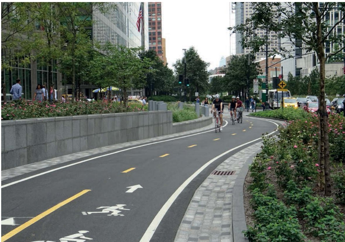
III. 4. Cycling implemented in a dense urban structure at the height of southern Manhattan.