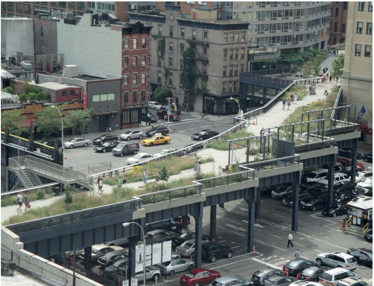
III. 1. High Line — a new tourist attraction in New York, but also an efficient pedestrian route.