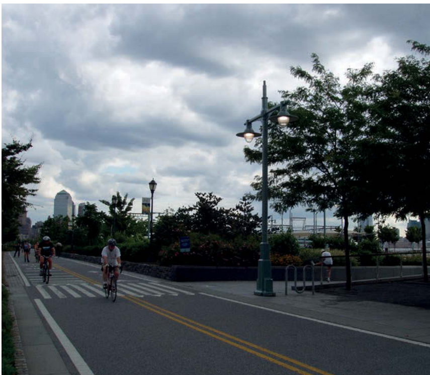
III. 2. Separated bicycle and pedestrian traffic along Hudson River Park.