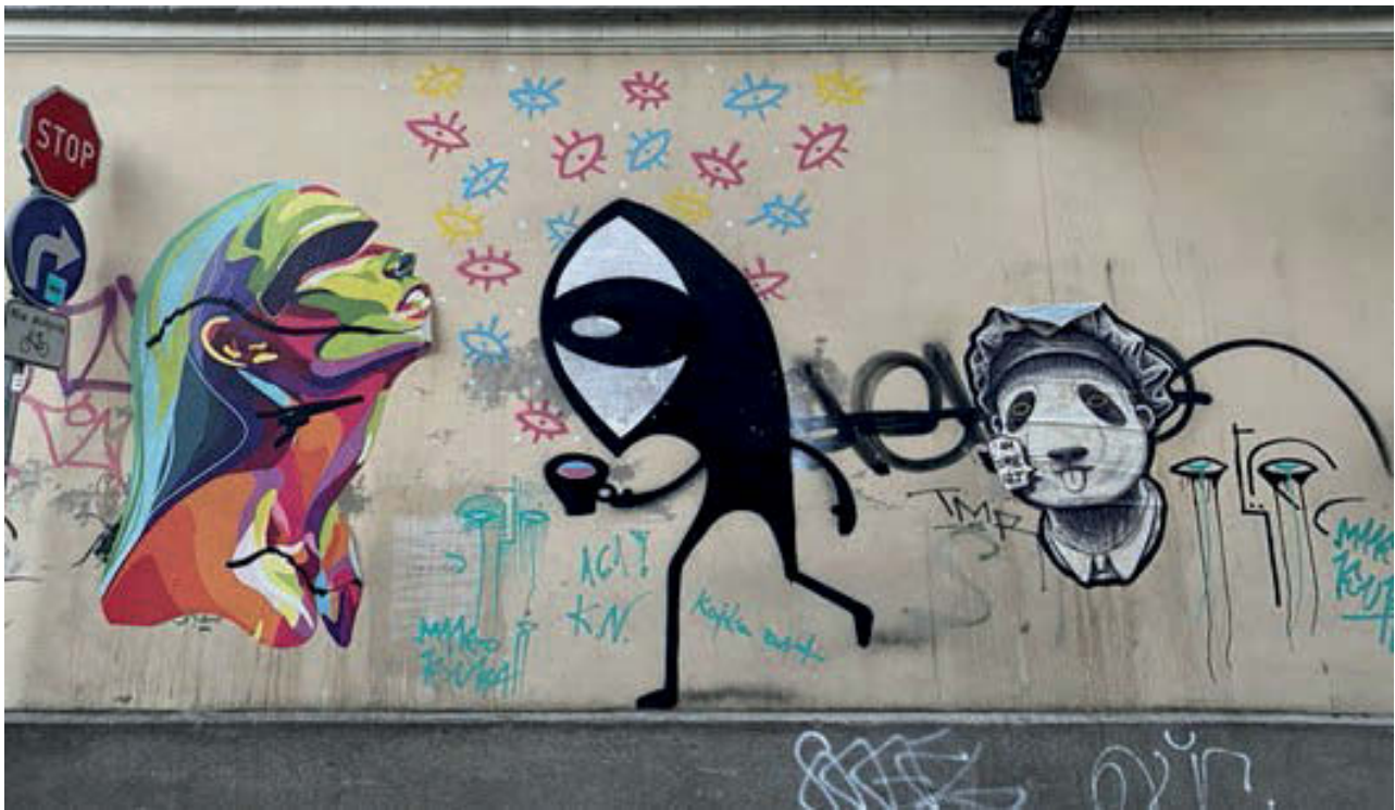
III. 3. Graphical symbols characteristic of the city of Poznań: Watcher and Imsomeart sticker.