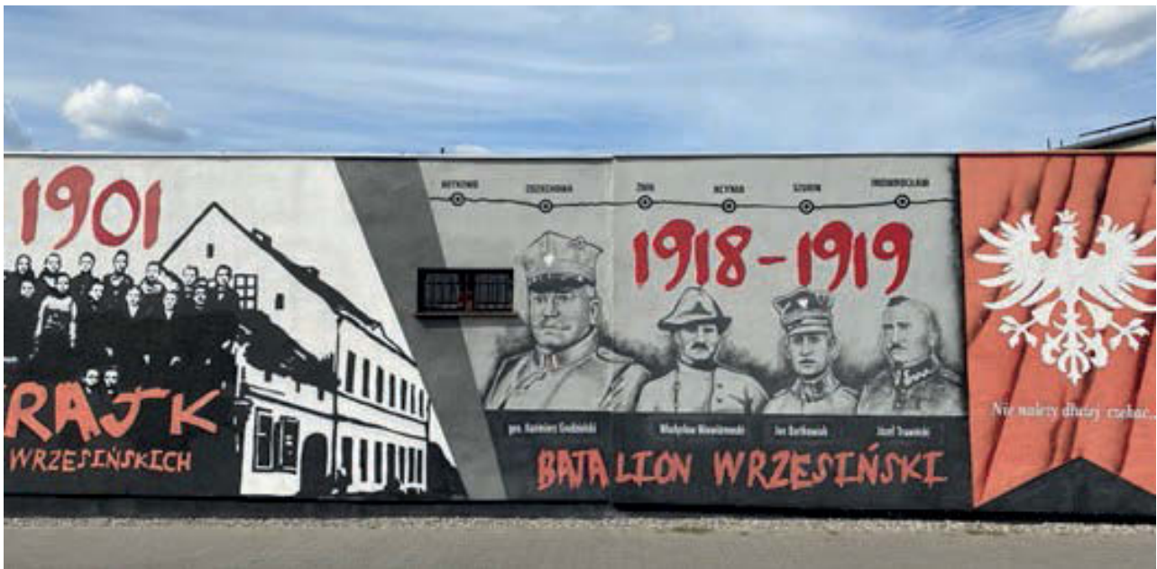
III. 4. Września, mural on the facade wall at Gnieźnińska Street, commemorating important historical events.