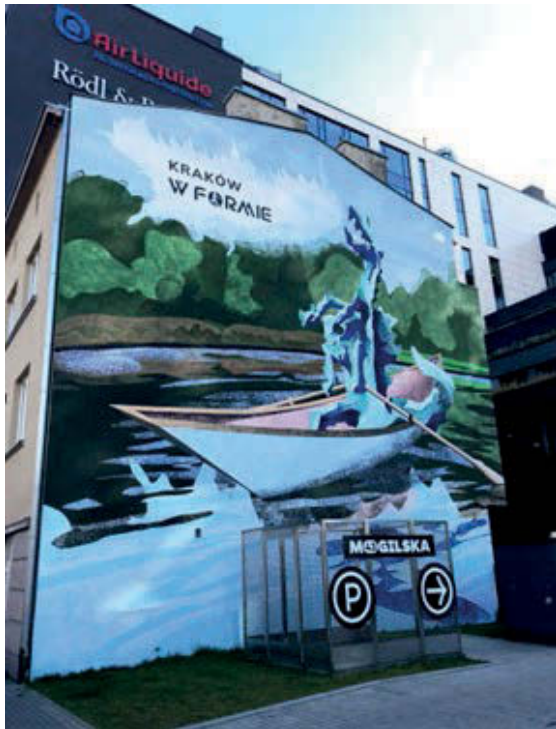
III. 6. Kraków, mural in which the legendary Wawel dragon promotes a healthy lifestyle.