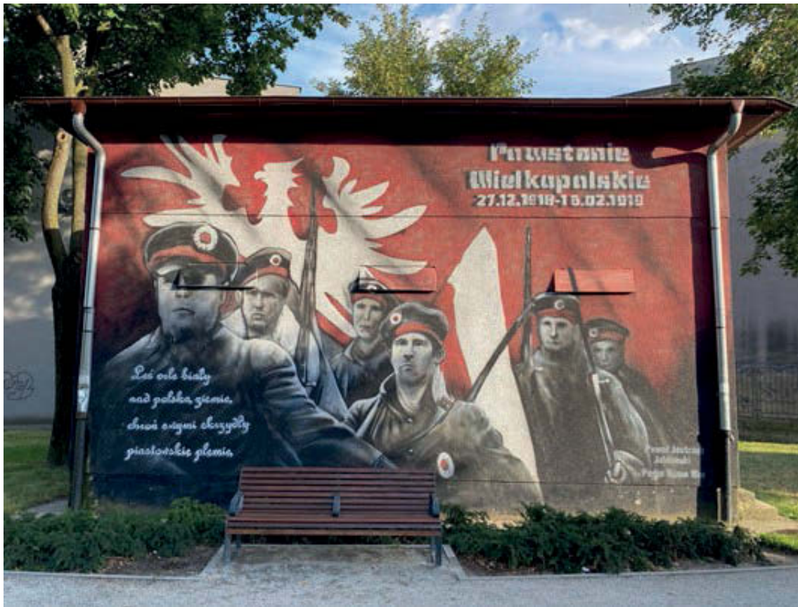
III. 5. Gniezno, mural commemorating the Greater Poland Uprising.