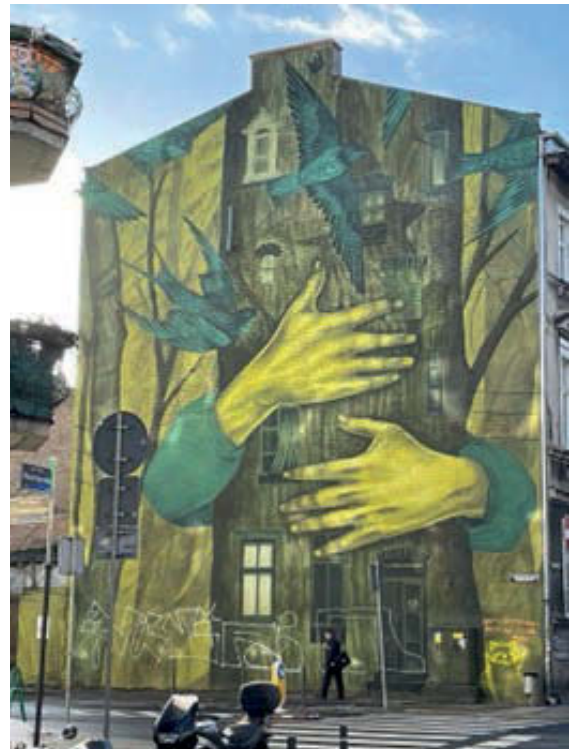
III. 7. Poznań, mural in which the greenery and trees promotes a healthy lifestyle.