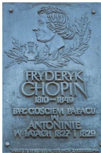
Ryc. 5. Tablica umieszczona na Pałacu Myśliwskim w Antoninie, która upamiętnia pobyty Fryderyka Chopina w latach 1827 i 1829.

w sprawie możliwości zdarzenia, w którym wszystkie trzy osoby, Chopin, Humboldt i Radziwiłł, mogły się jednocześnie spotkać. Zielnica wyraża wątpliwości co do wiarygodności roku 1829 widocznego na obrazie, ponieważ w czasie od 12 kwietnia do 29 grudnia 1829 roku podczas swojej rosyjsko-syberyjskiej podróży Humboldt znajdował się daleko od Berlina. A na początku roku 1829 Humboldt był zajęty przygotowaniem do tej poważnej wyprawy badawczej, jednocześnie w godzinach nocnych przeprowadzał pomiary deklinacji magnetycznej w określonych odstępach czasowych.