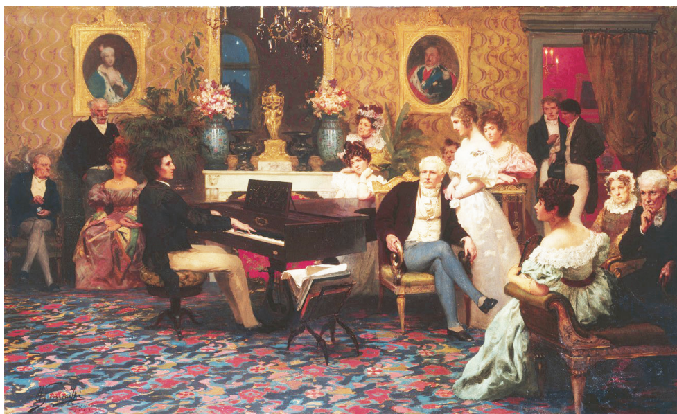
Ryc. 1. Obraz Chopin w salonie księcia Antoniego Radziwiłła w roku 1829 , Henryk Siemiradzki (1887). https://commons.wikimedia.org/wiki/File:Chopin_concert.jpg?uselang=de

Obraz „Chopin w salonie księcia Antoniego Radziwiłła w roku 1829” powstał w roku 1887 (ryc. 1). Został namalowany przez Henryka Hektora Siemiradzkiego (1843–1902) na zamówienie Karola Kozłowskiego (1833–1917), pedagoga, pisarza i wydawcy z Poznania.