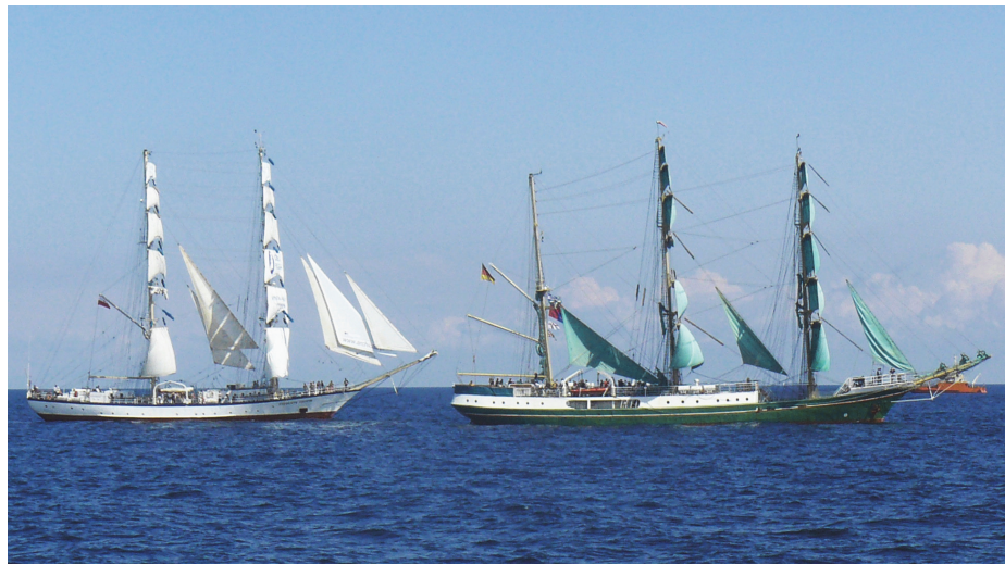
Ryc. 6. Spotkanie dwóch żaglowców: dwumasztowy bryg „Fryderyk Chopin” i trójmasztowy bark „Alexander von Humboldt”, w dniu 10 lipca 2007.

https://commons.wikimedia.org/wiki/File:Alexander_von_Humboldt_i_Fryderyk_Chopin.JPG