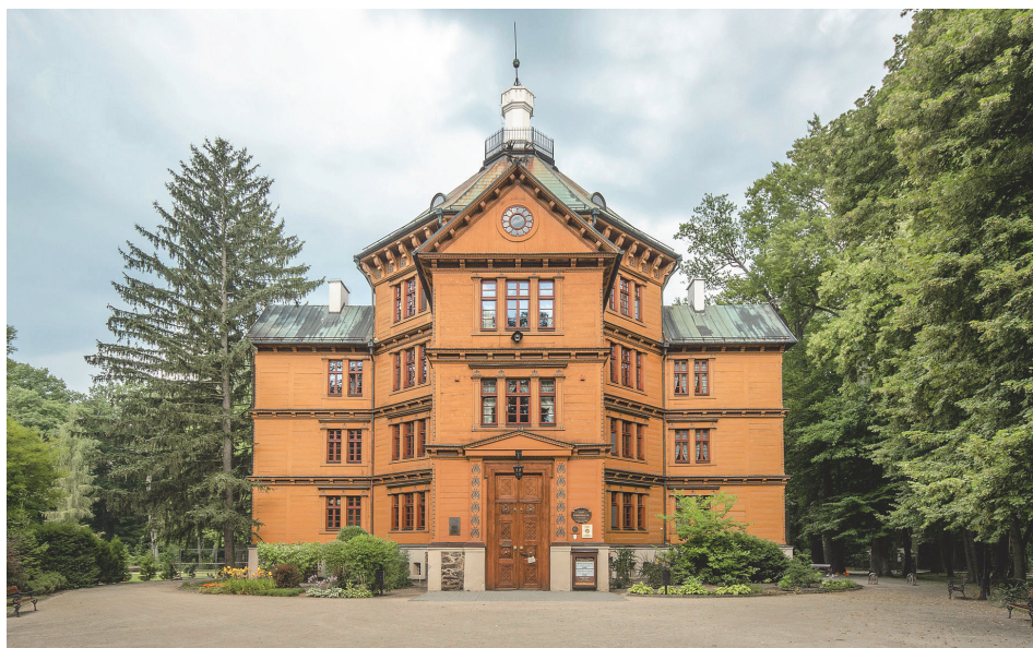
Ryc. 4. Pałac Myśliwski rodziny Radziwiłłów w Antoninie [8].