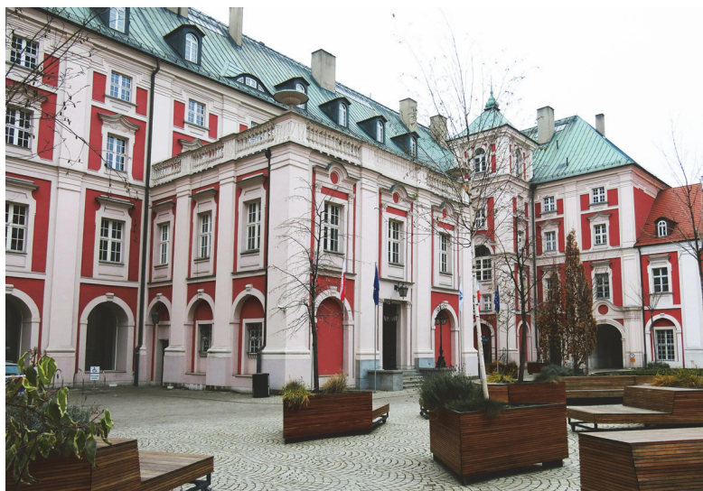
Ryc. 3. Collegium Jezuickie w Poznaniu.