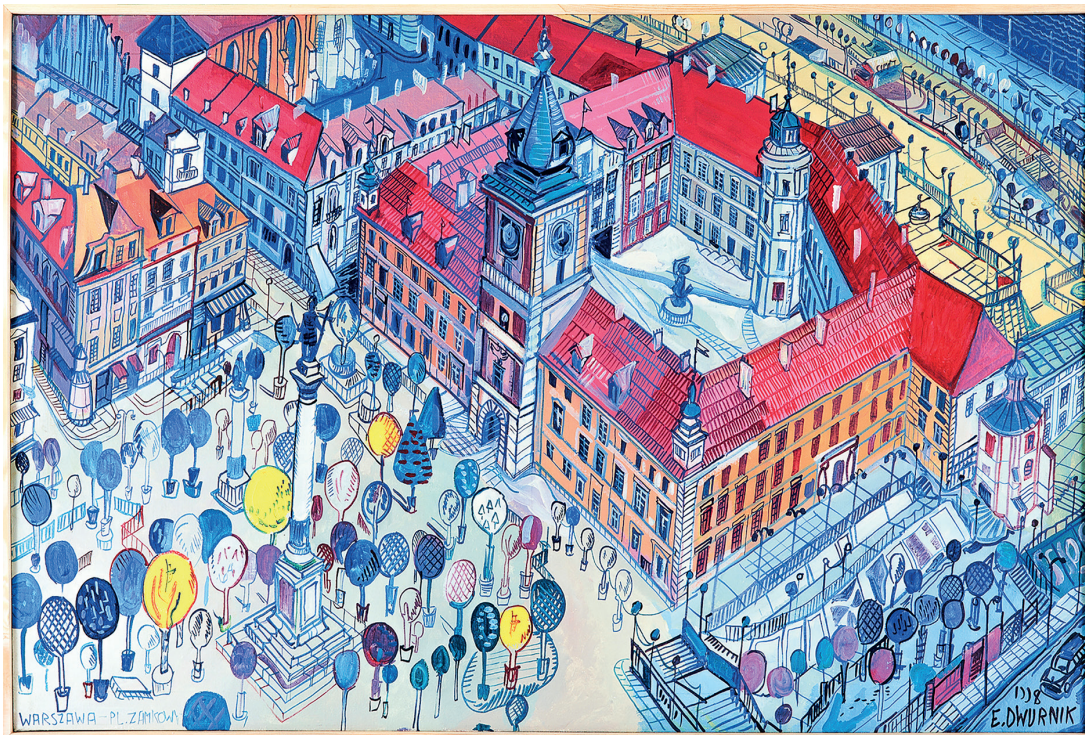
Edward Dwurnik, Plac Zamkowy – Zamek, drzewka, cykl Warszawa, 1998, olej, płótno, 114×146 cm