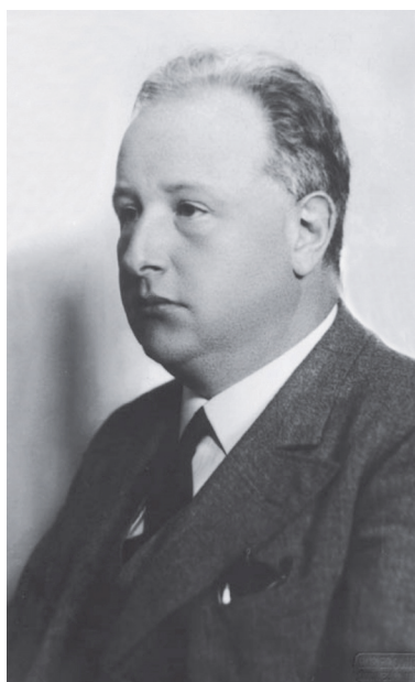
(Jakub Karol Parnas 1884–1949)

W niniejszym artykule przybliżamy postać jednego z najwybitniejszych biochemików II Rzeczypospolitej: Jakuba Karola Parnasa. Jego badania naukowe odegrały kluczową rolę w zrozumieniu fundamentalnego procesu biochemicznego, jakim jest glikoliza. Jednakże Parnas to nie tylko wybitny naukowiec, lecz również osobowość, która przyciągała do siebie wielu młodych entuzjastów biochemii, którzy następnie tworzyli swoje własne grupy badawcze. Niepowtarzalna kariera naukowa Parnasa jest jednocześnie symbolem wyjątkowego środowiska intelektualnego Galicji oraz Uniwersytetu Jana Kazimierza we Lwowie w 20. i 30. latach ubiegłego wieku. To właśnie tam powstawały przełomowe odkrycia naukowe, które miały wpływ na rozwój nie tylko biochemii, ale także wielu innych dziedzin nauki.